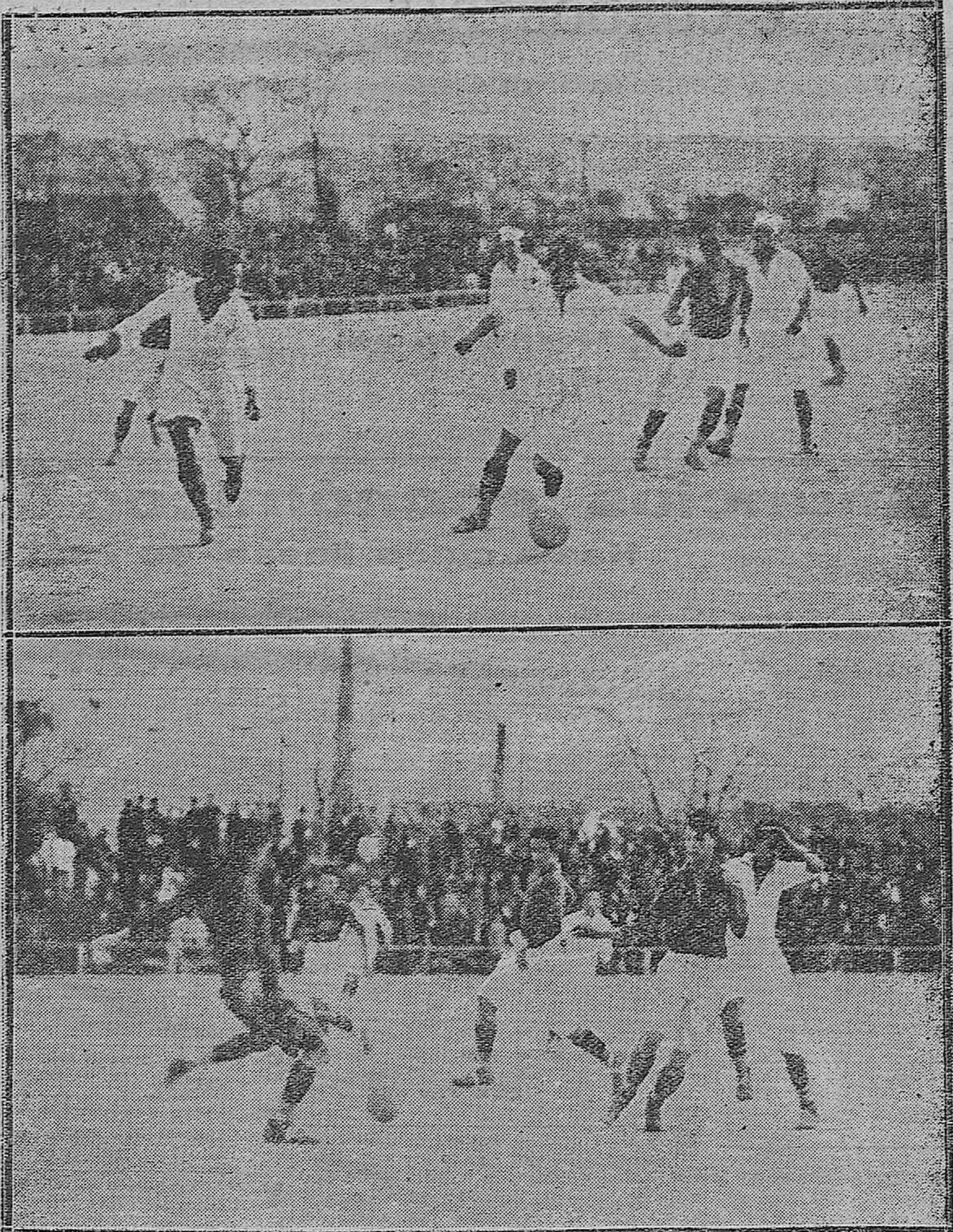
NOTAS GRAFICAS DEPORTIVAS.--Dos momentos interesantes del partido de fútbol jugado el domingo entre los equipos San Román F. C., de Sevilla y Real Córdoba Sporting Club, que empataron a dos tantos. Dicho encuentro, por su técnica, finura y delicadeza dejará grato recuerdo entre los amantes de este deporte.