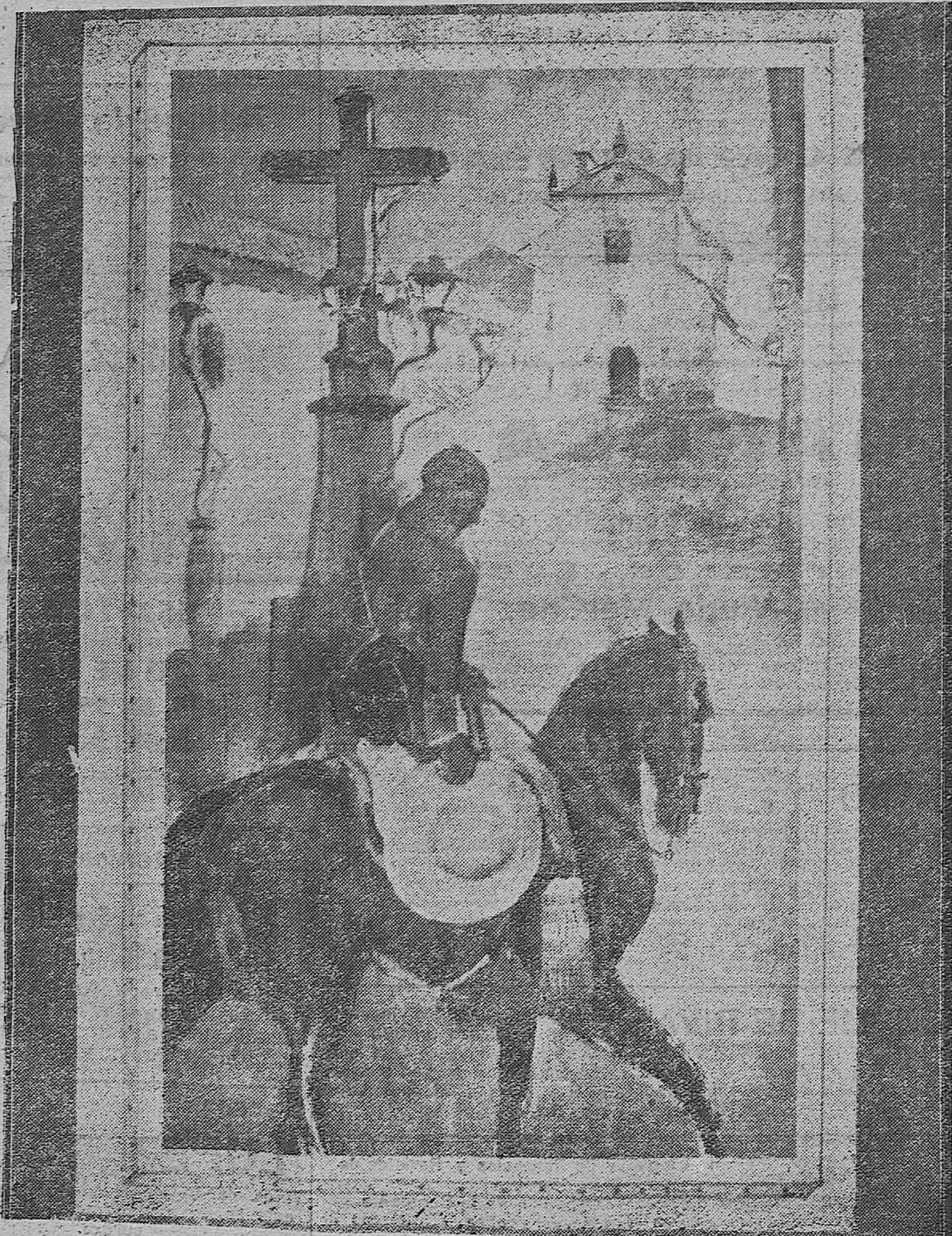
EL CONCURSO DE CARTELES PARA FERIA.--Boceto de cartel que llama la atención por la corrección del dibujo y su originalísimo asunto.