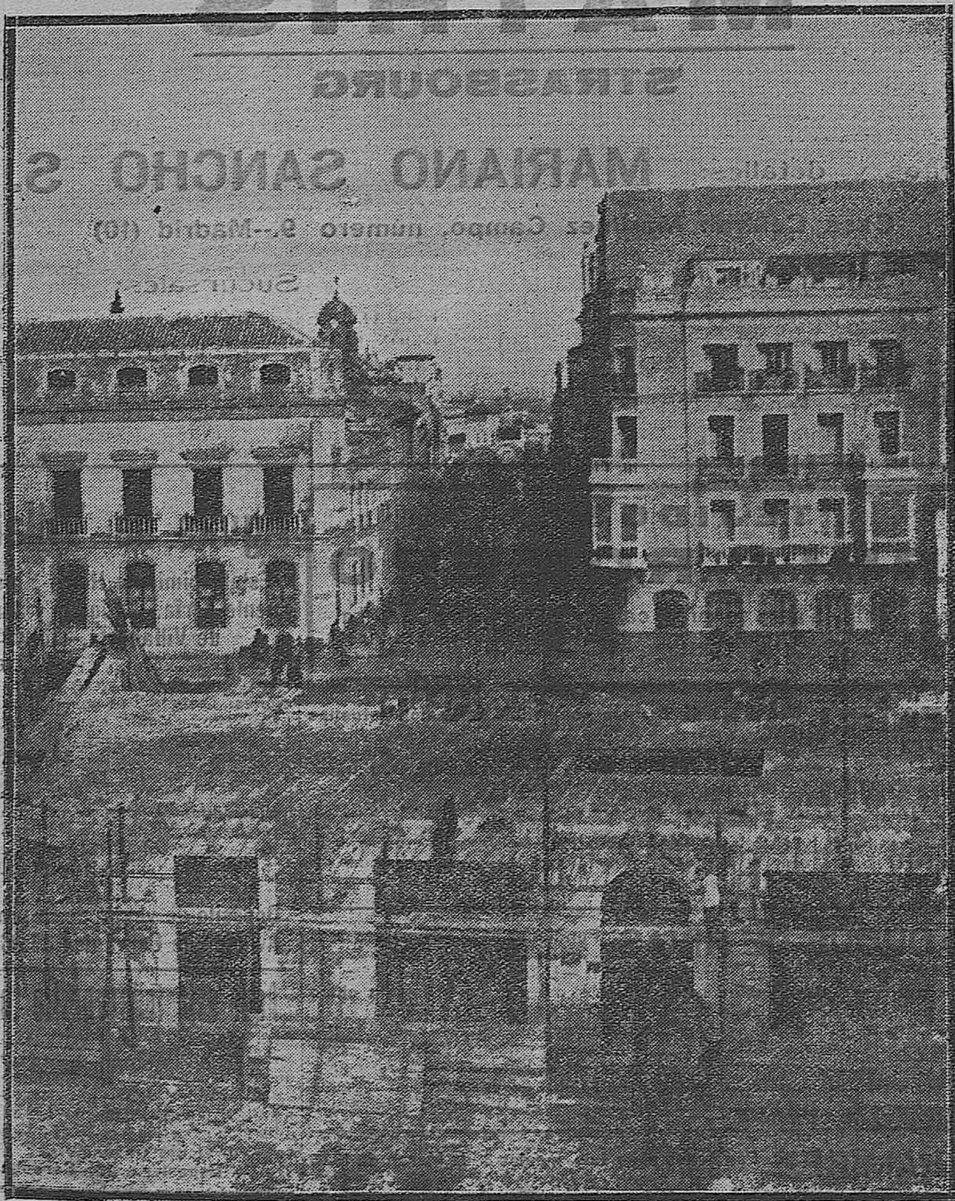
LAS REFORMAS DE CÓRDOBA. —Perspectiva que ofrecía hoy la calle Claudio Marcelo y la Plaza de las Tendillas, desde uno de los balcones del Café de La Perla.