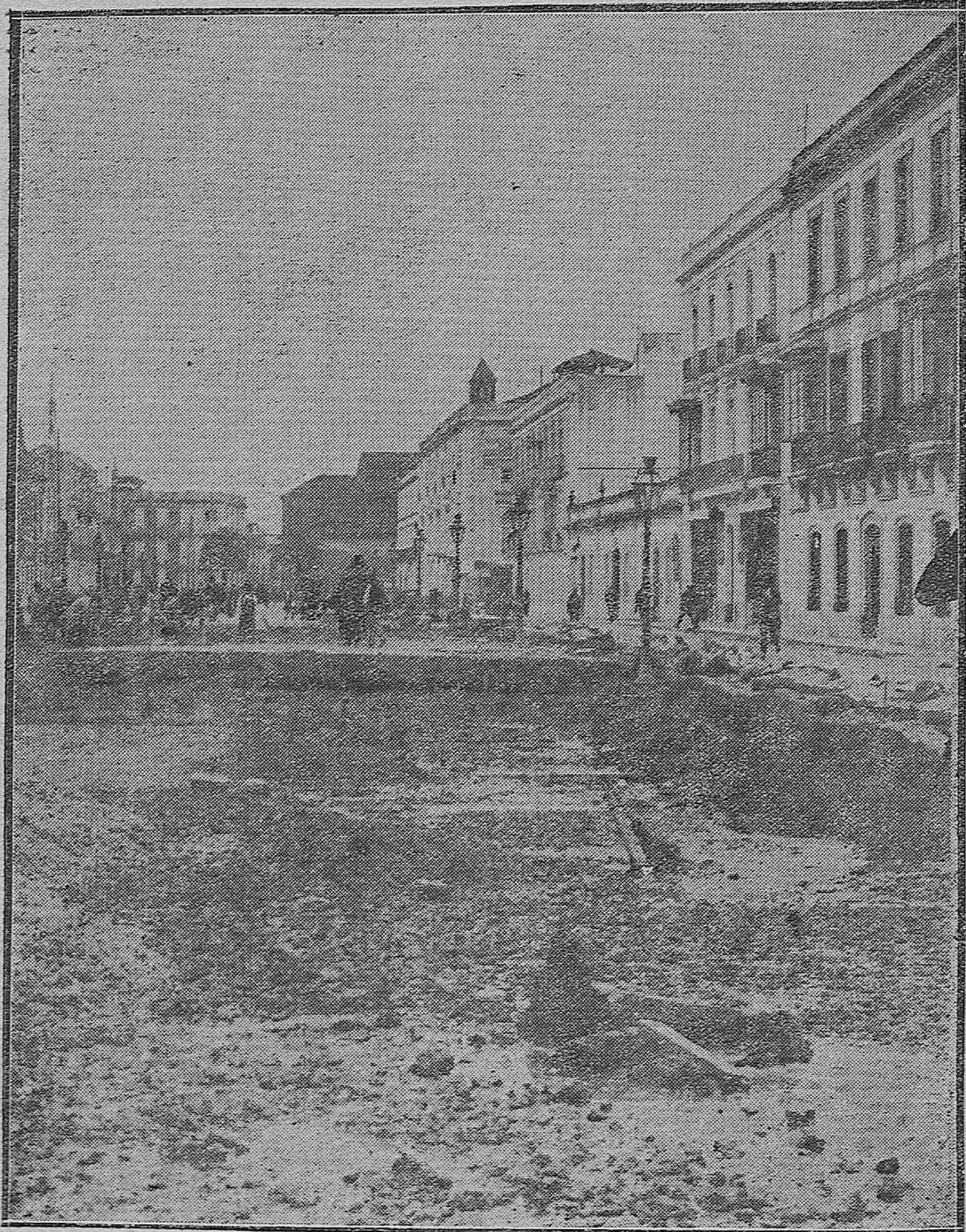
LAS REFORMAS DE CORDOBA.—Actual aspecto que ofrece el paseo del Gran Capitán, en el que con gran actividad se realizan las obras para convertirlo en moderno boulevard.