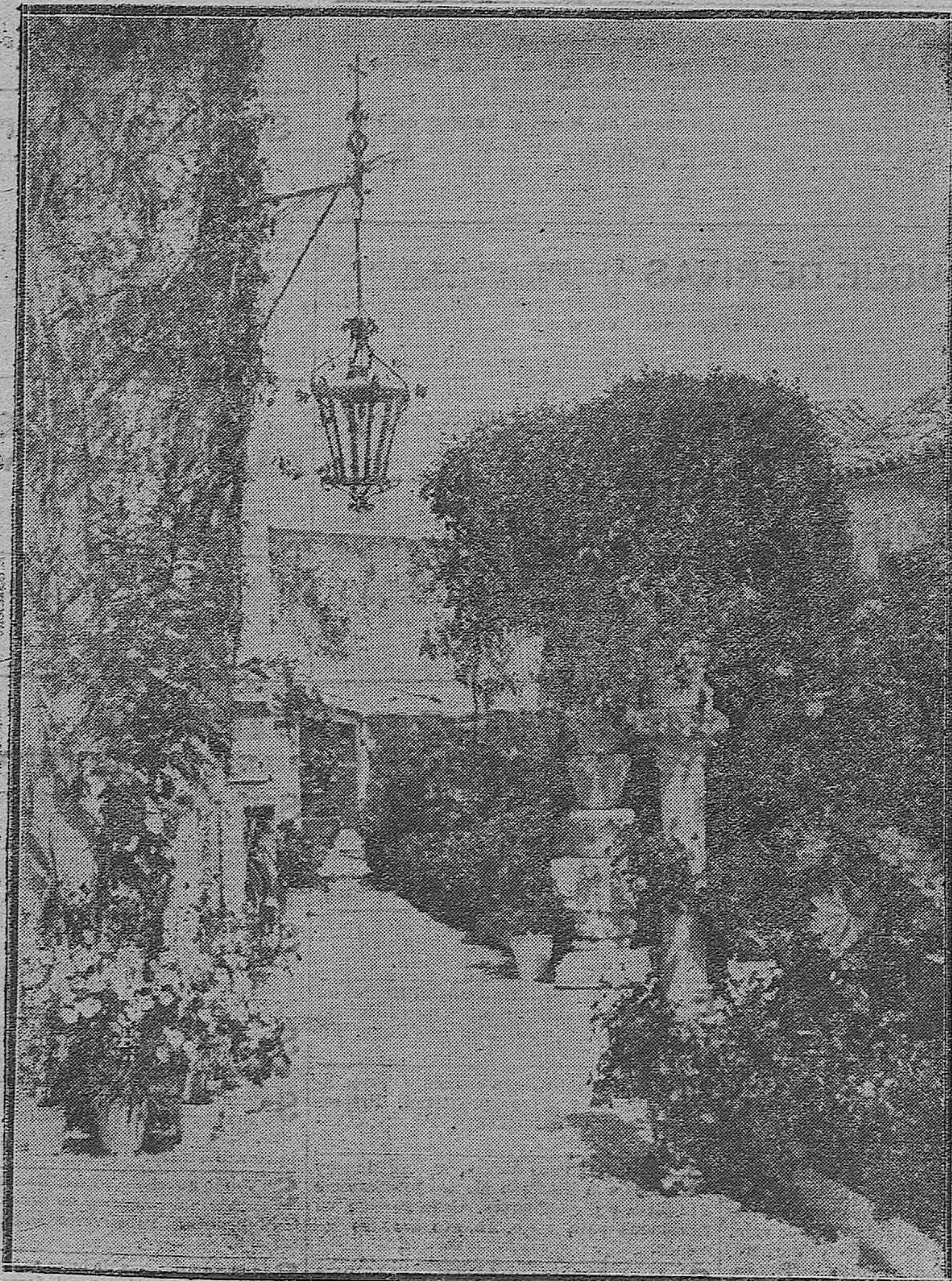
LOS JARDINES DE CORDOBA.--Pintoresco rincón del de los Romero de Torres. 7.