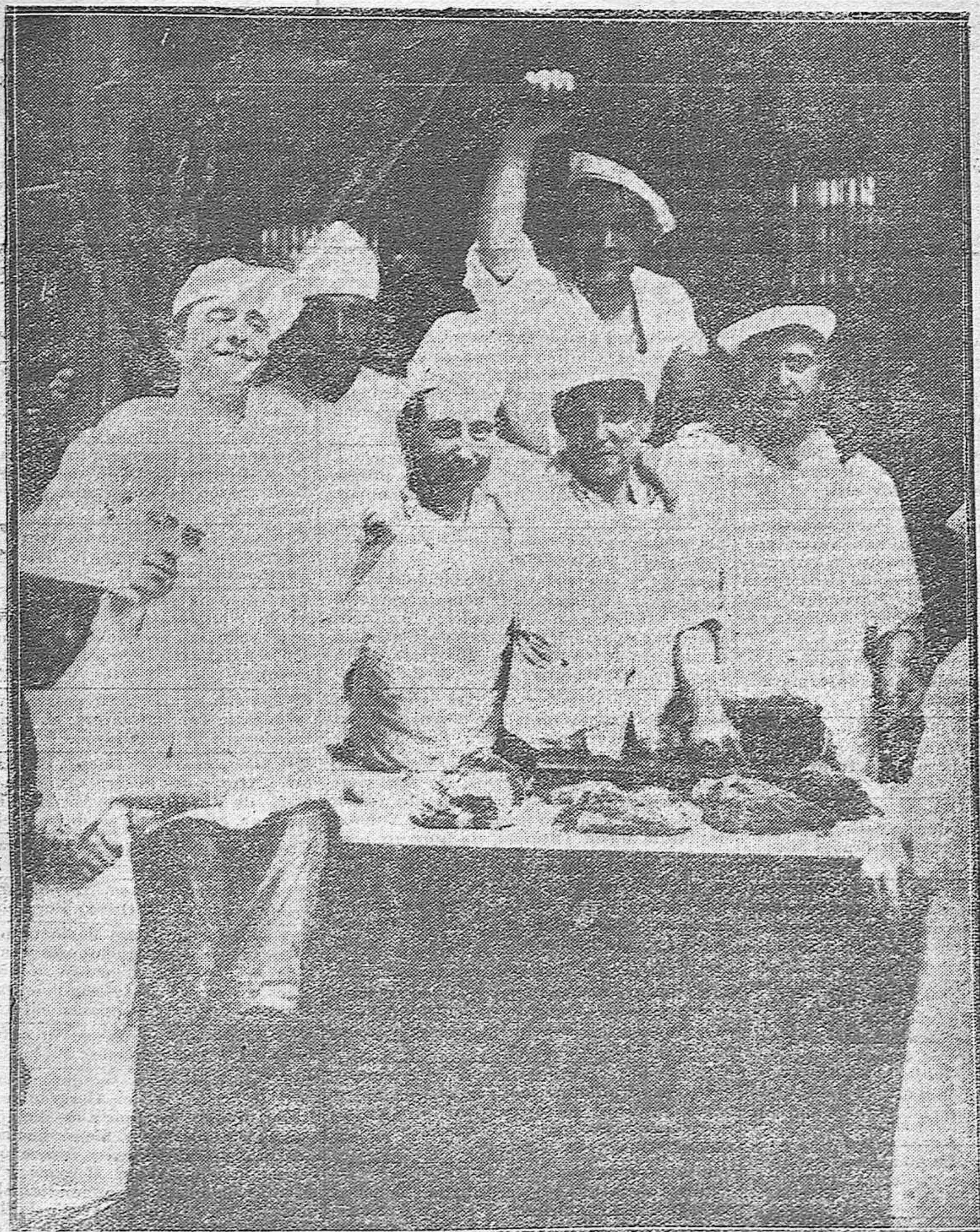
Grupo de carniceros del mercado central, luciendo los caprichosos gorros que les han sido impuestos por la comisión municipal de Abastos y Mercados.