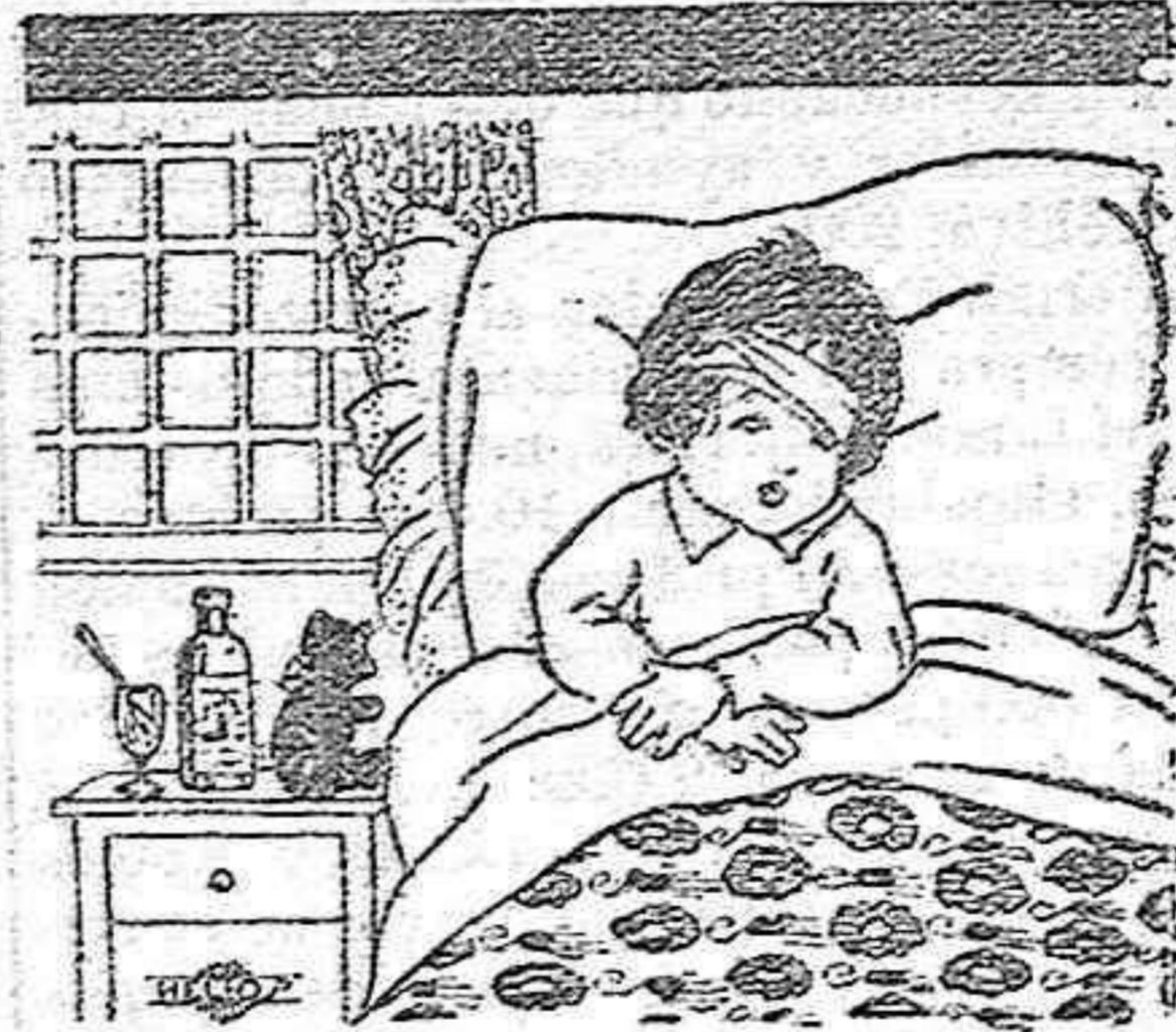
Manolito está en cama. ¿Qué tendrá Manolito?

Se repartirán limosnas a los pobres y habrá gran mercado de ganados con abundantes pastos y abrevaderos.