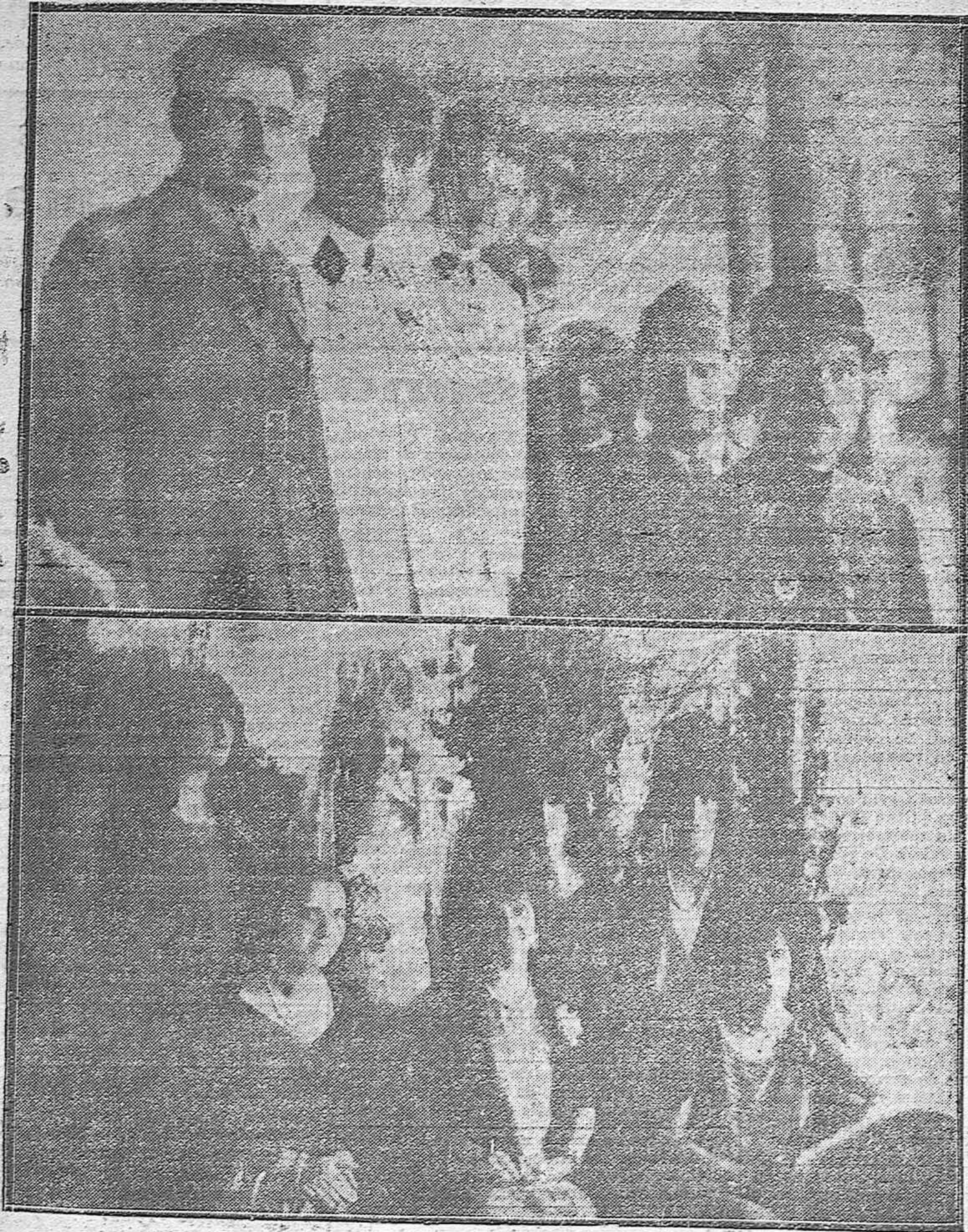
NOTAS GRÁFICAS MALAGUEÑAS.--Los aviadores franceses y norteamericanos de la escuadrilla Lafayette que aterrizó en Málaga de paso para Fez, presenciando la corrida de la Prensa.--Aristocráticas damas y señoritas que presenciaron la fiesta.