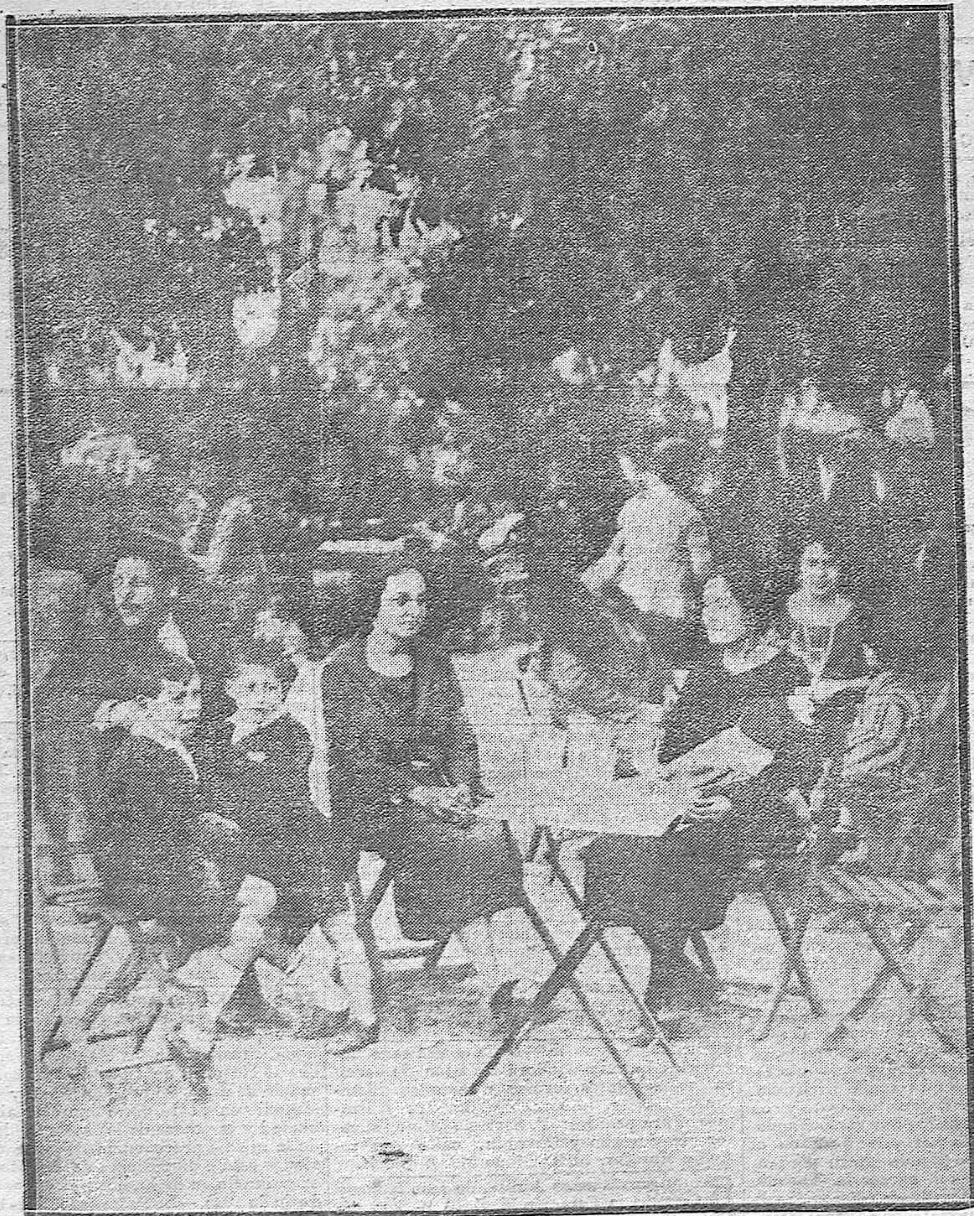
EL VERANEO EN CORDOBA.--Los que van a buscar una temperatura agradable a los Jardines de la Agricultura.