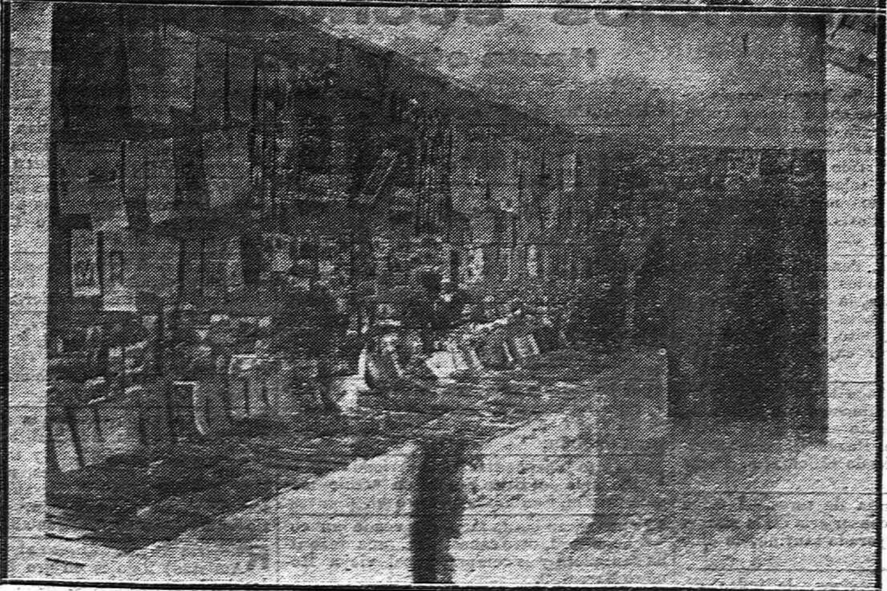
1) Grupo de esperantistas que han visitado nuestra capital.--2) Exposición de obras esperantistas instalada en el Círculo de la Amistad.