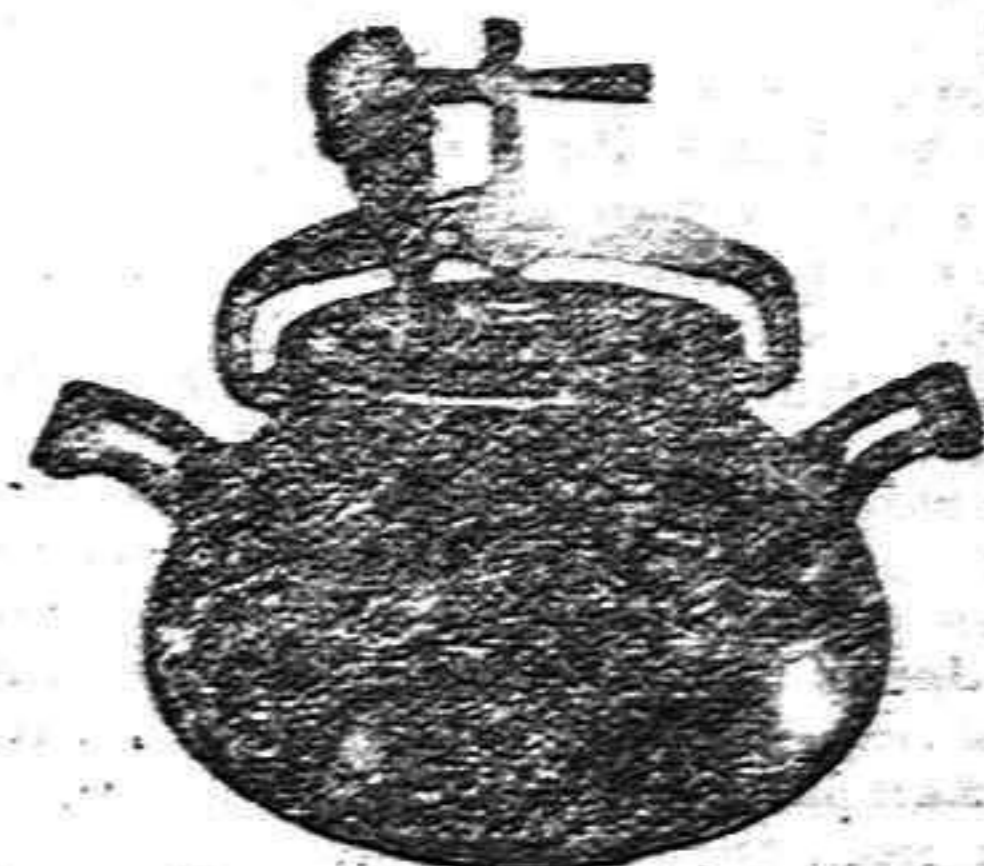
Marmita Hispano-Olla Expres.

Batería de cocina - Herrajes para obras y herramientas en general