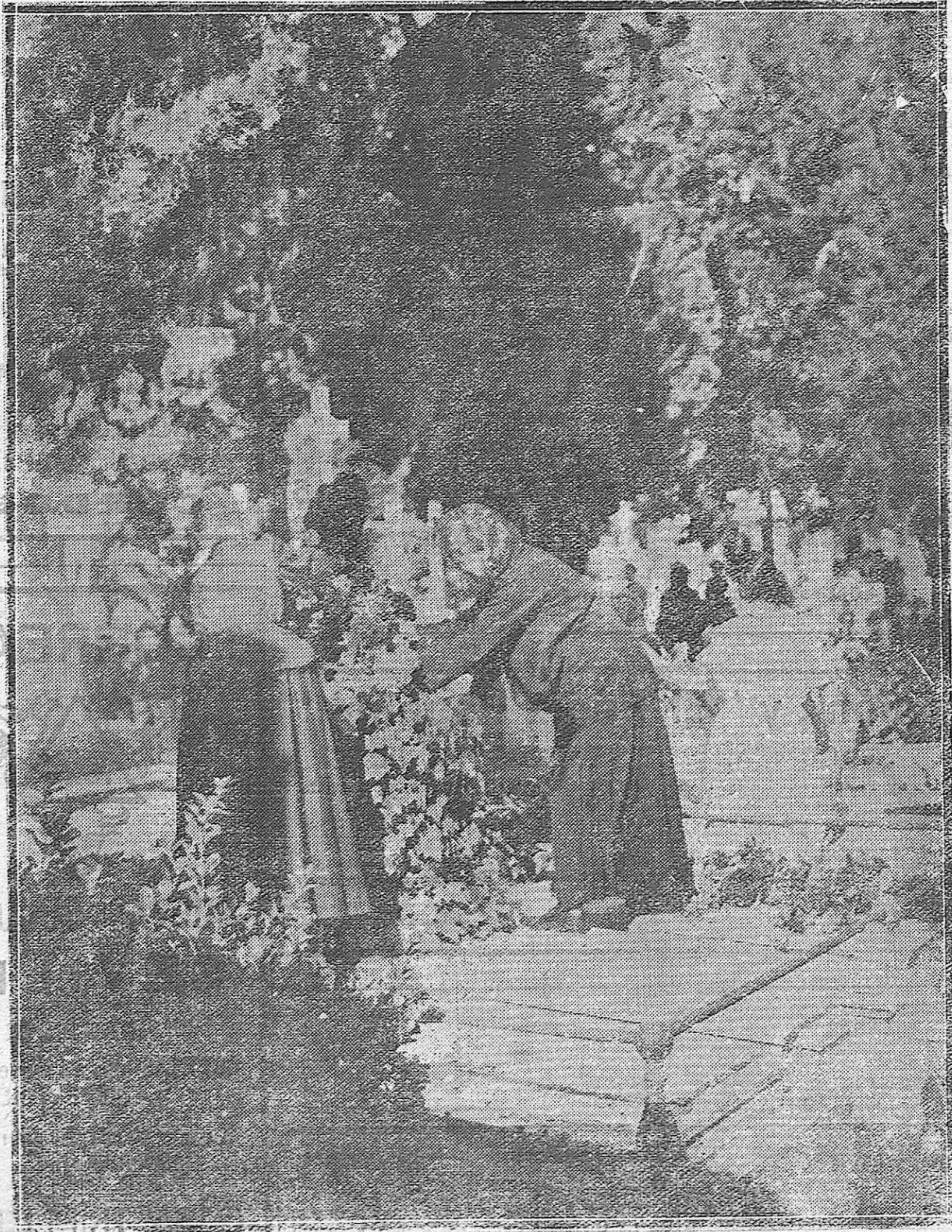
EN RECUERDO DE LOS QUE FUERON.—INTERESANTE FOTOGRAFIA OBTENIDA EN EL CEMENTERIO DE LA SALUD EN LA MAÑANA DE HOY.