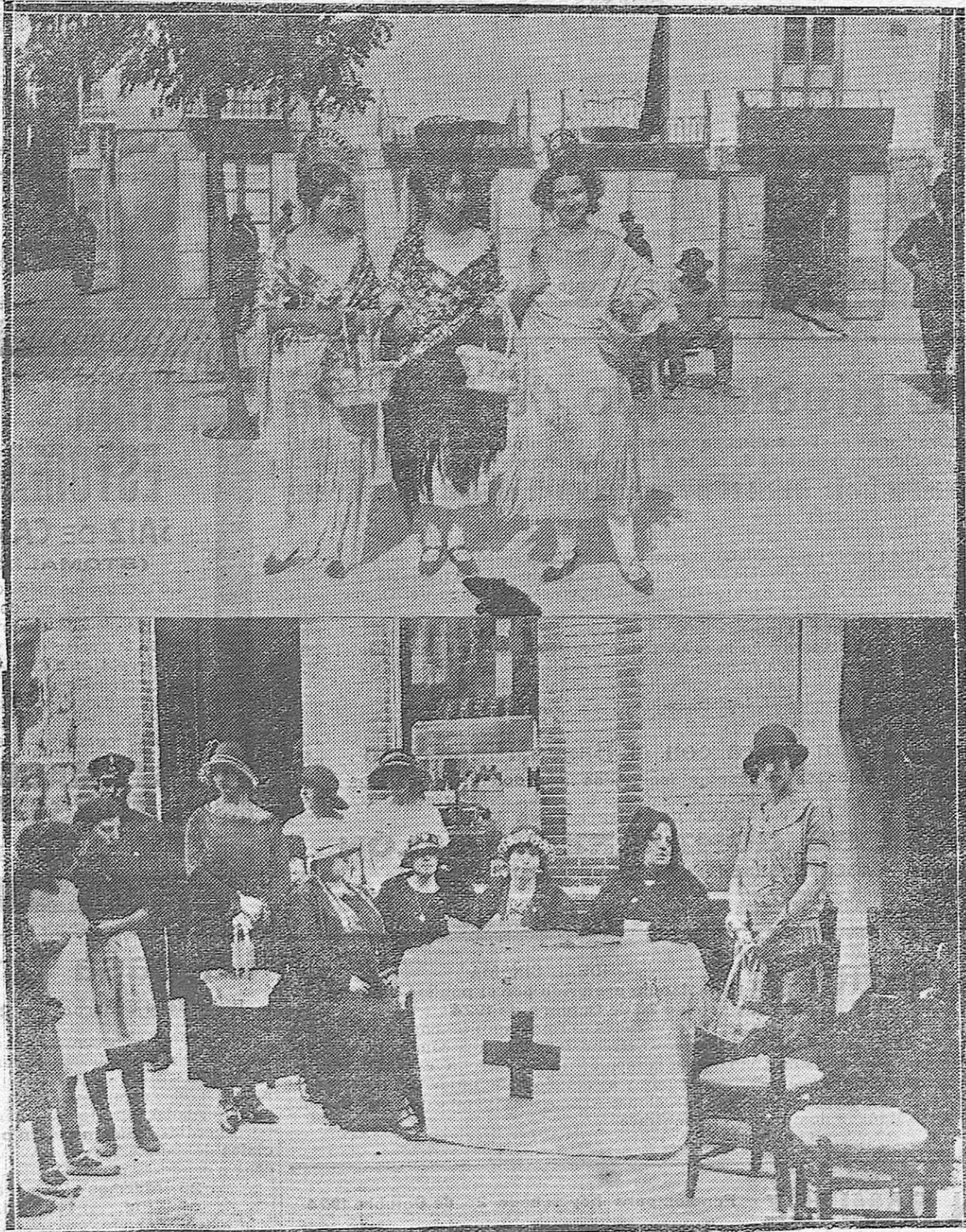
JAÉN.—1) Tres lindas señoritas postulantes en la fiesta de la Banderita.—2) Mesa petitoria presidida por distinguidas señoras.