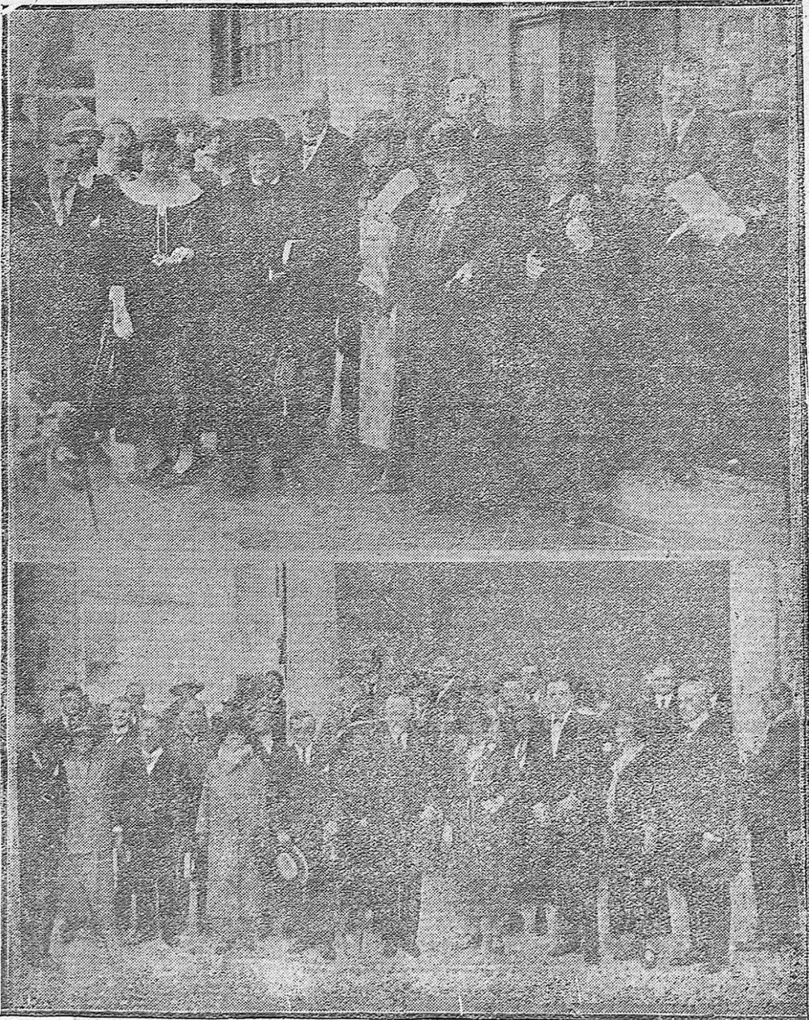
CÓRDOBA.—MIEMBROS DEL CONGRESO DE GEODESIA Y GEOFISICA EN SU VISITA AL MUSEO.