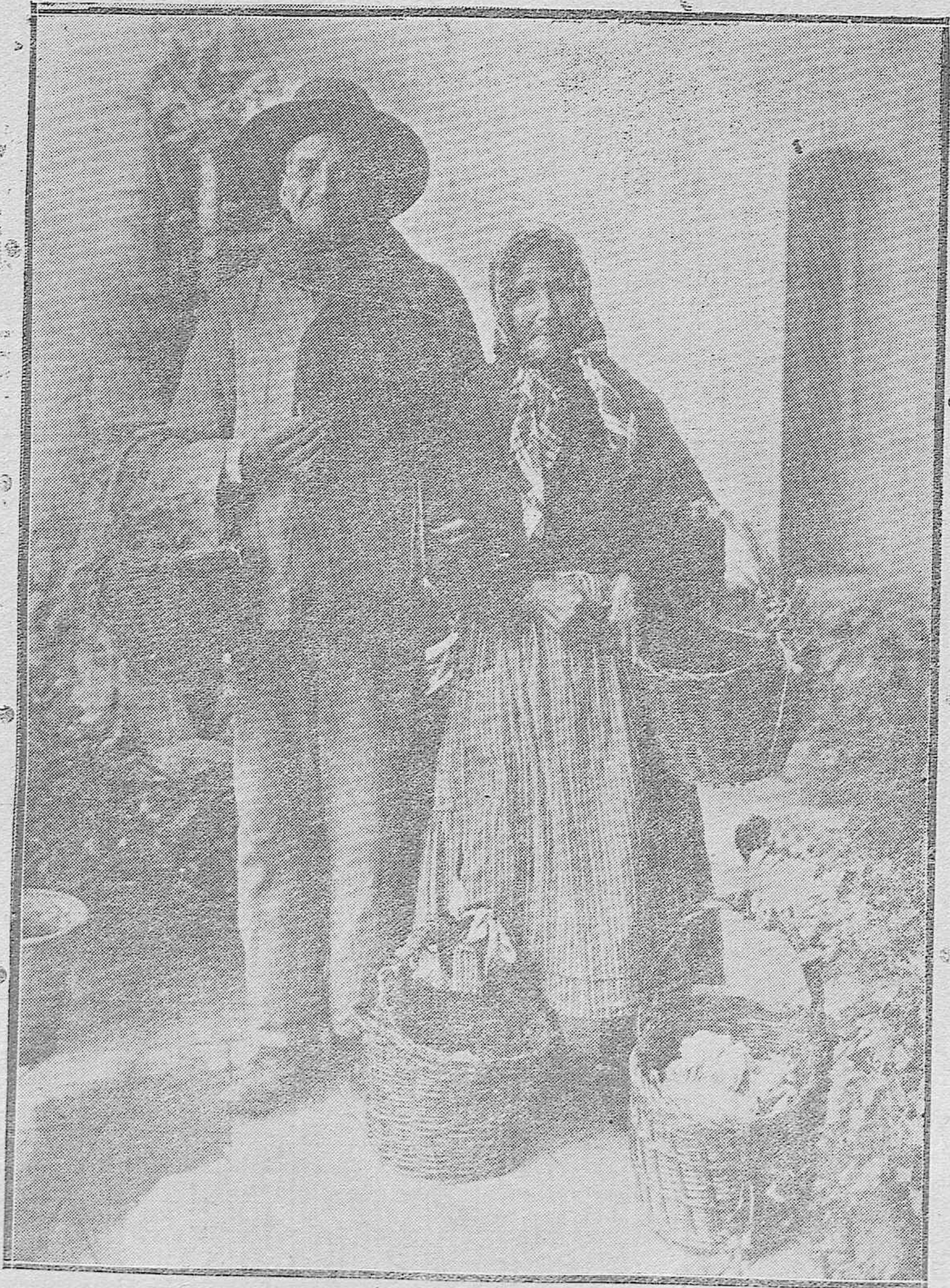
ESCENAS DE LA VIDA POPULAR CORDOBESA.--"Niñas, los caracolerós, caracoles gordos y chicos"; este es el pregón del simpático y popular matrimonio de los viejecitos cordobeses.