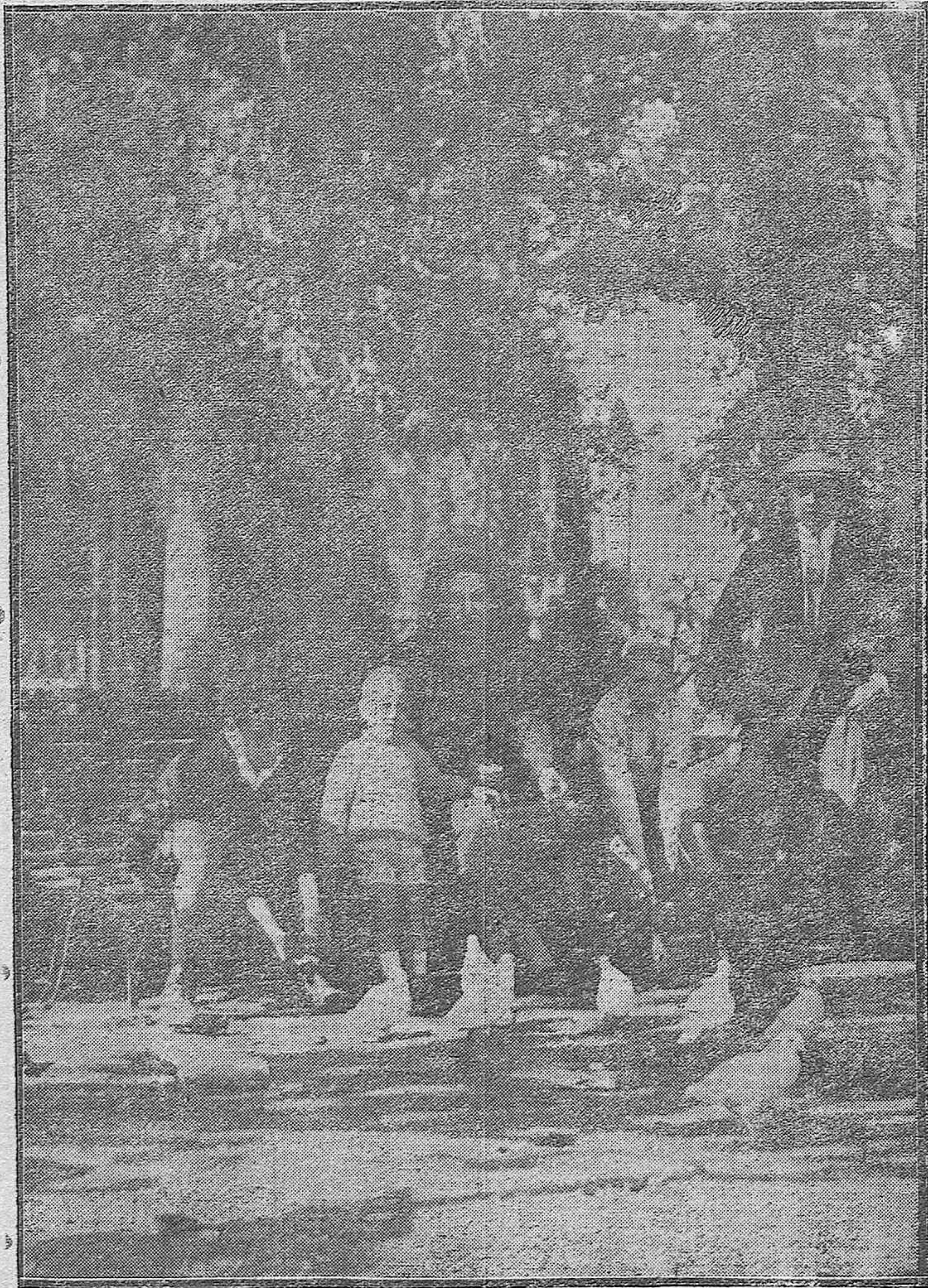
EN LOS JARDINES DE LA AGRICULTURA.--Una prueba evidente de los progresos conseguidos en la educación de los niños, que de manera tan simpática familiarizan con las palomitas de nuestro futuro parque.