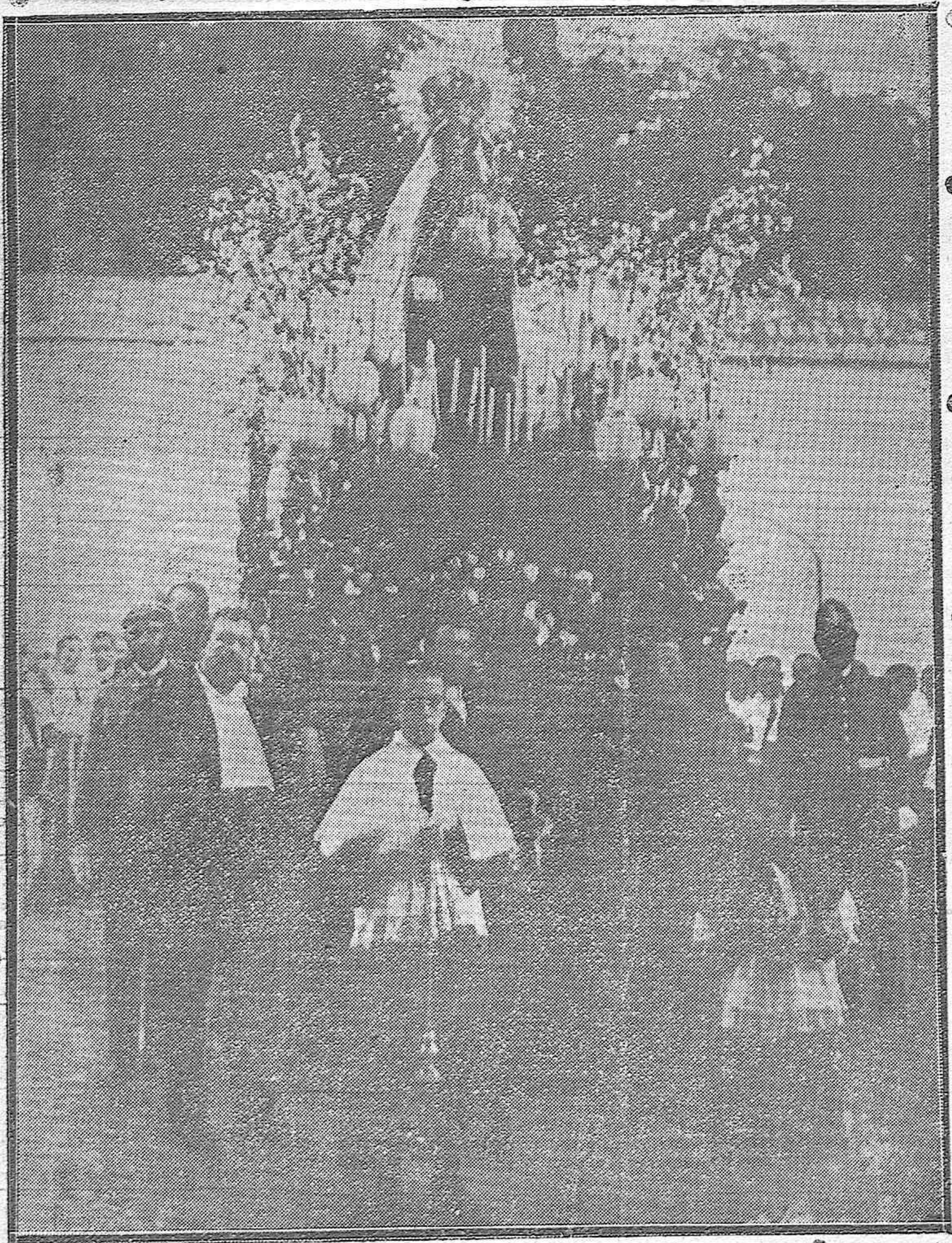
La procesión de la Virgen del Carmen a su salida ayer tarde del convento de San Cayetano.