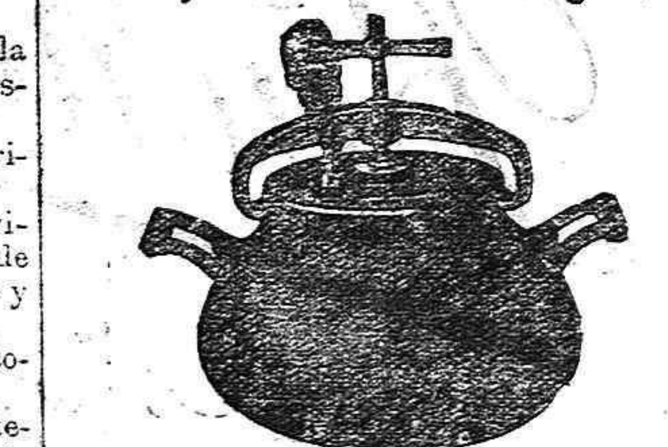
Marmita Hispano-Olla Expres.

Batería de cocina - Herrajes para obras y herramientas en general