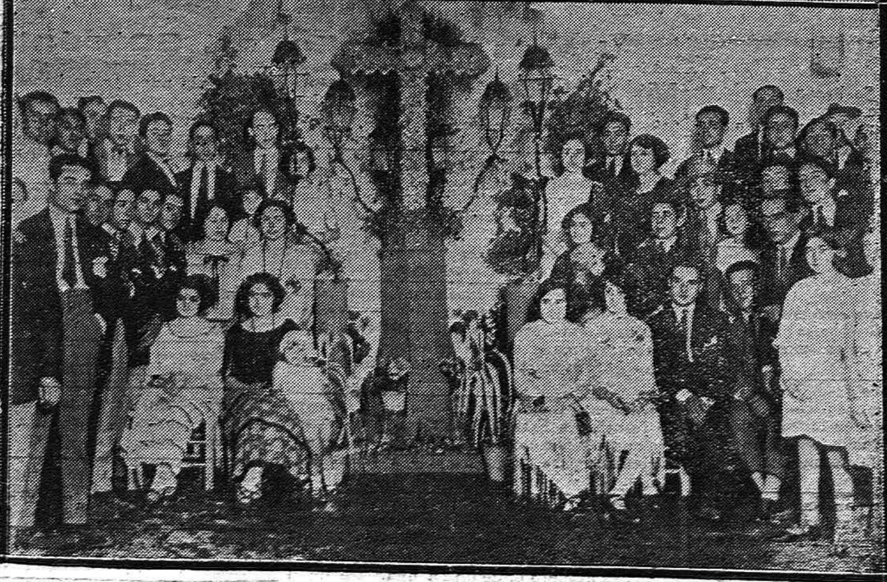
1) Momento de ser entregado por el alcalde de Fernán-Núñez al Deán de la Catedral señor Blanco Sancha, el título de hijo predilecto de aquella villa.—2) Grupo de lindas nenas concurrentes a la Cruz de Mayo instalada por la Juventud Recreativa en la calle de Ocaña.