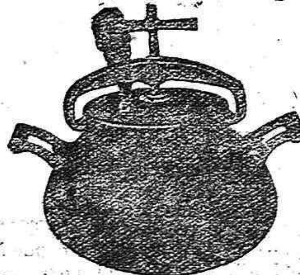
Marmita Hispano-Olla Exprés.

Batería de cocina - Herrajes para obras y herramientas en general