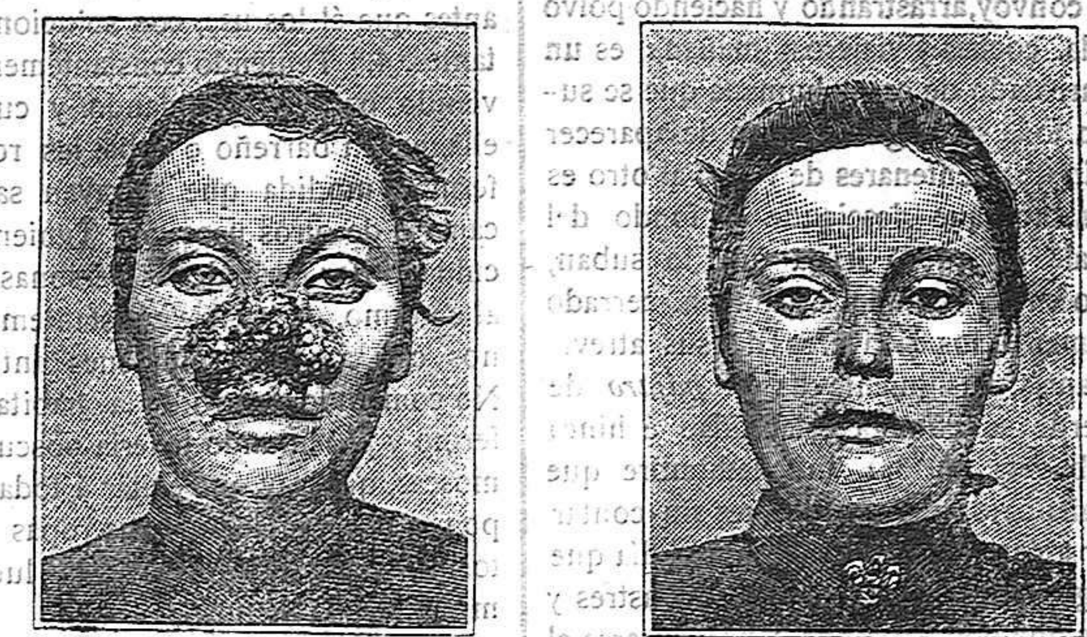
Antes de la curación Después de 15 días de tratamiento

CURACIÓN DE LAS ENFERMEDADES DE LA PIEL Y TAMBIÉN DE LAS LLAGAS DE LAS PIERNAS LA PIEL MALAS DE LAS PIERNAS