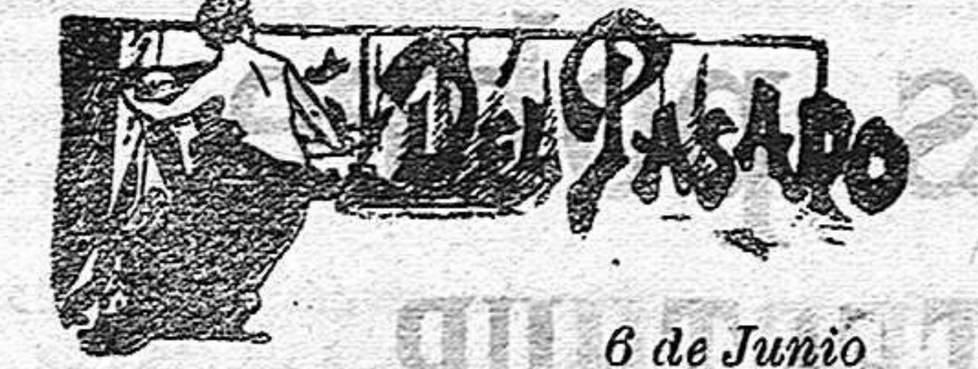
6 de Junio