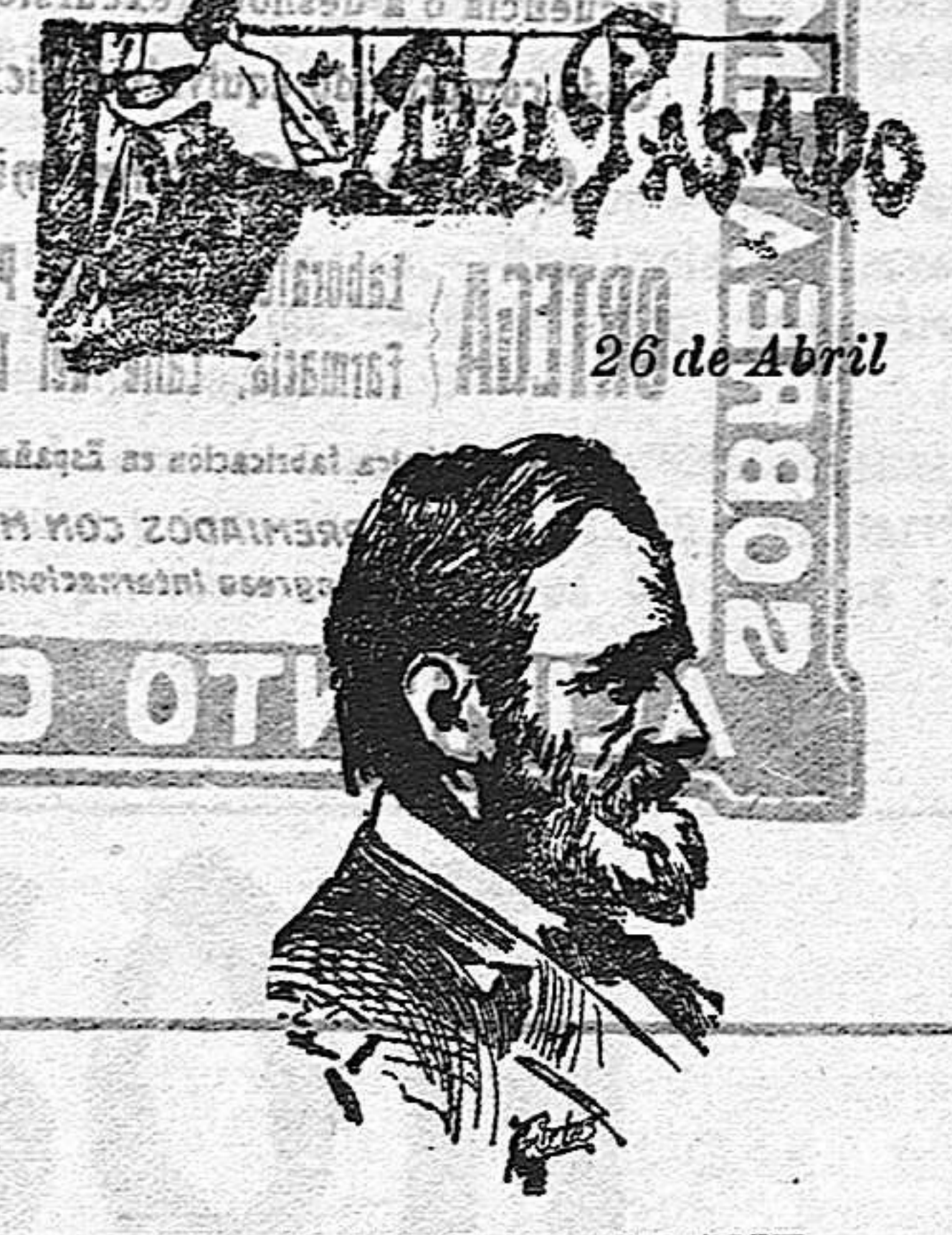
EL GENERAL GRANT