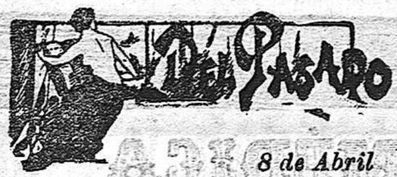
8 de Abril