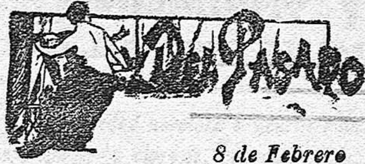
8 de Febrero

El pequeño mínimo barométrico situado ayer sobre el Mediterráneo superior, se ha corrido hacia el S. E. Su centro está situado entre la isla de Cerdeña (Cagliari 761'5 mm) y las costas de Túnez. La borrasca de las Azores, haciéndose más intensa, continúa en la misma posición (Punta Delgada 732'2 mm). Siguen las altas presiones ocupando las latitudes del Norte (Valencia 780'6 mm) y nuestra Península. Nuestra región de Levante ha sido ligeramente afectada por el mínimo del Mediterráneo, entrando sobre la costa catalana del mar, pero el cambio de tiempo cuya contingencia señalábamos, no se ha operado por completo por la trayectoria que ha seguido el citado mínimo barométrico hacia el S. E. a diferencia de los últimos. Es lo probable que el tiempo continúe en la misma disposición que hoy. Las temperaturas máximas han sido de 17 en Murcia y Alicante. La mínima de 13 bajo cero en Teruel. (De la Federación Agraria de Levante.)