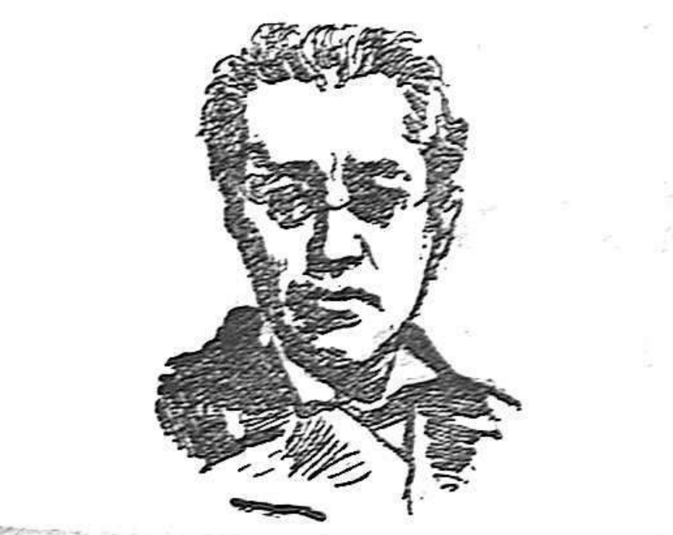
MANUEL OROZCO Y BERRA