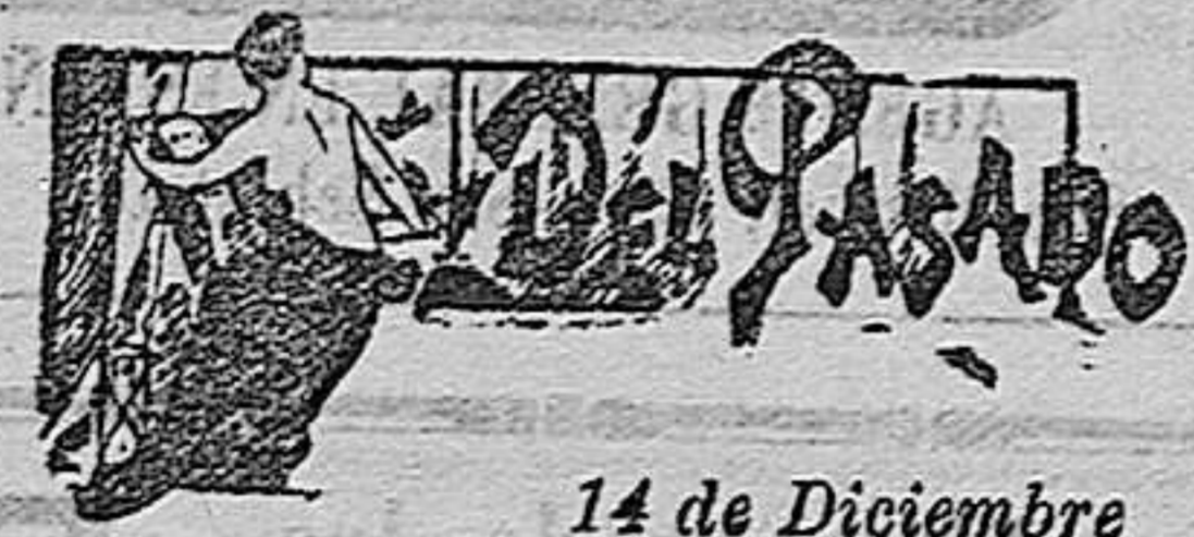
14 de Diciembre