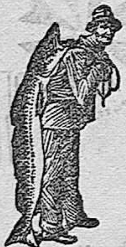
¡Obtengase siempre la Emulsión con esta marca «El Pescador», marca del procedimiento SCOTT!