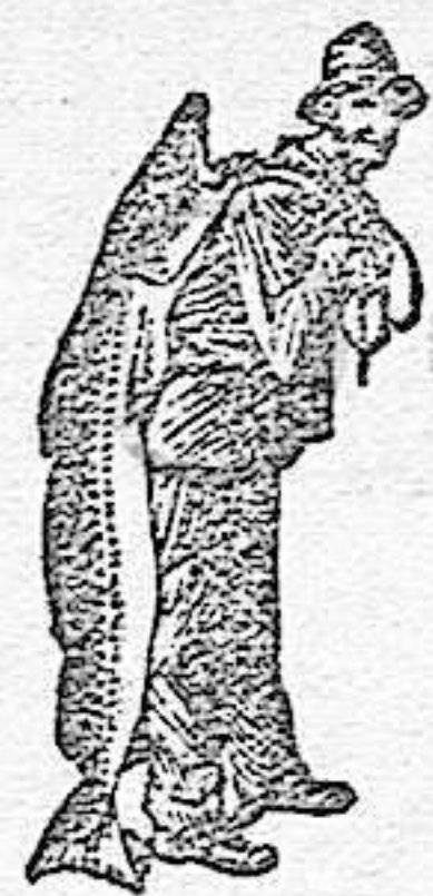
Obténase siempre la Emulsión con esta marca "El Pescador", marca del procedimiento SCOTT.

(Firmado) Marcos de la Pena. Quintanillabon (Burgos), Septiembre 20, 1906.