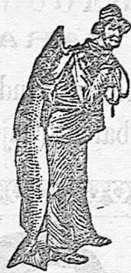
¡Obténase siempre la Emulsión con esta marca «El Pescador», marca del procedimiento Scott!

Cualquiera que sea el tiempo que ha estado V. tosiendo, la emulsión de SCOTT le cortará la tos. Nada le curará una tós con tanta rapidez y tan permanentemente como la de SCOTT. La Emulsión SCOTT es única en su clase. Supera de mucho á todas las emulsiones similares, en poder curativo. Compre esas y malgastará su dinero. Compre la de SCOTT y se curará Vd. Ninguna otra emulsión posee tan altas recomendaciones como la de SCOTT. En todas las droguerías y farmacias.