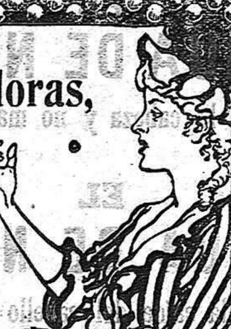
Ahorre el grabado á los ojos y verá Vd. la píldora entrar en la boca.

DE VENTA EN LAS BÓTICAS DEL MUNDO ENTERO. 40 Píldoras en Caja.