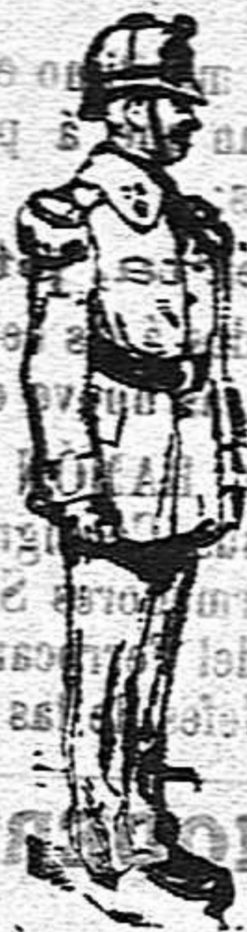
Soldado de infantería

En primer lugar el bombacho ha sido substituido por el pantalón largo, en la forma que lo representa el presente dibujo.