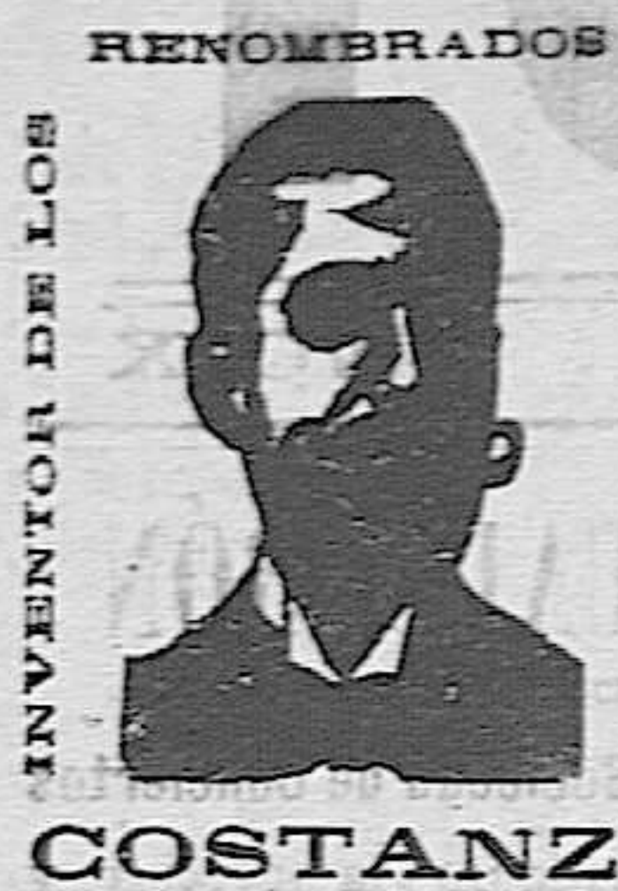
INVENTOR DE LOS