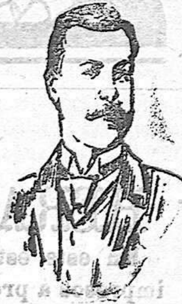
General Count Vasilchikoff