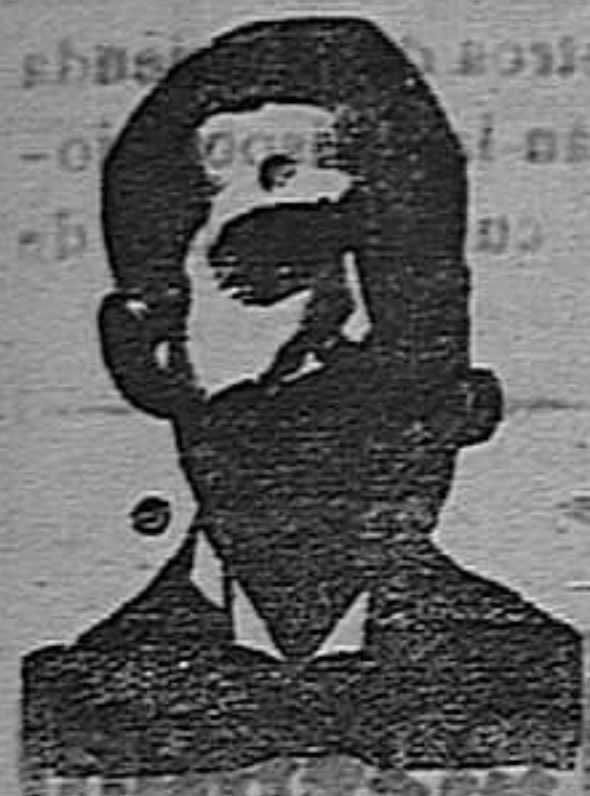
A. SALVATI COSTANZI CALLE DIPUTACIÓN, 349 BARCELONA

Confites Antivenéreos Roob Antisifilítico Inyección Vegetal