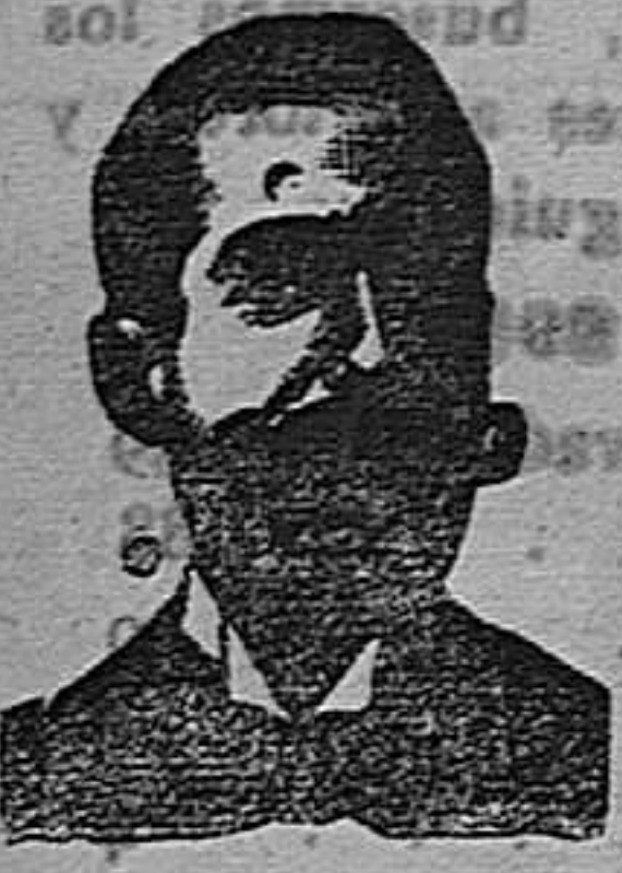
A. SALVATI COSTANZI CALLE DIPUTACION, 435 BARCELONA

Confites Antivenéreos Roob Antisifilítico Inyección Vegetal