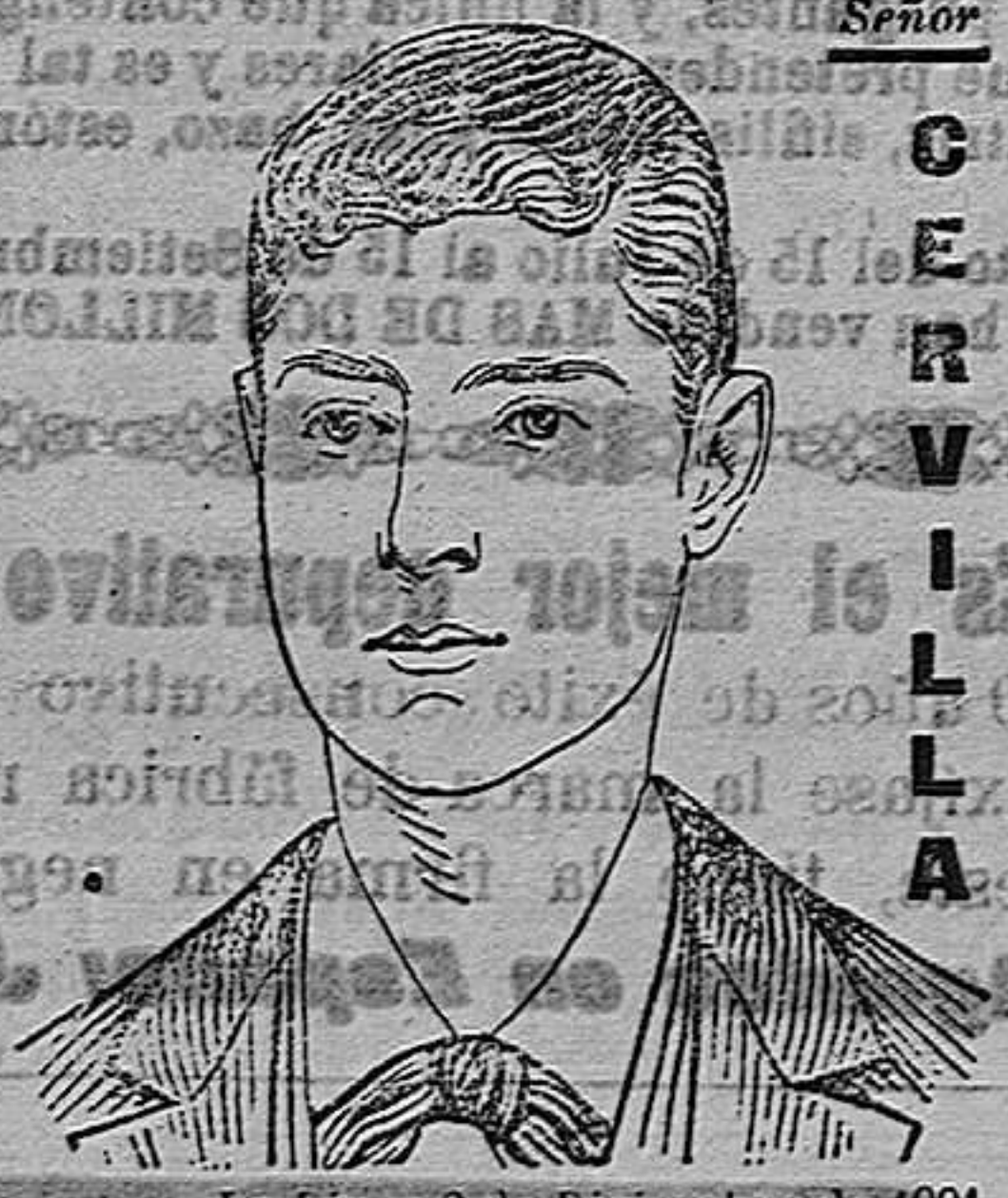
La Línea 2 de Diciembre de 1901.

Desde mucho tiempo, venía sufriendo de un fuerte catarro bronquial, acompañado de opresión y accesos de tos, que por momentos me quitaban la respiración. Leyendo en los periódicos que la Emulsión Scott era el remedio para ese mal, decidí probarla y estoy muy complacido de haberlo hecho así.