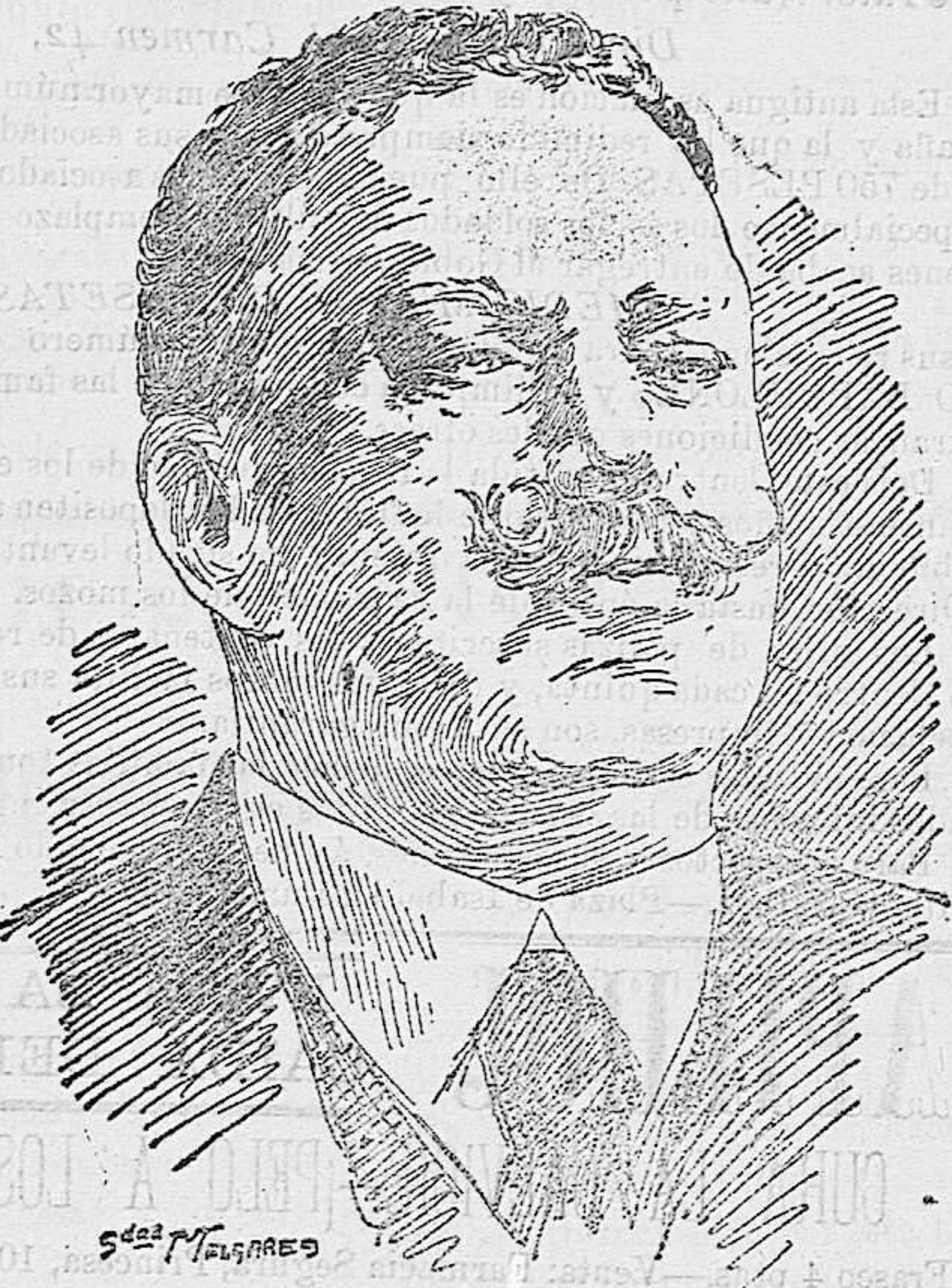
Carlos I de Portugal

producen los tristes sucesos ocurridos en Lisboa. Y que no decimos nada