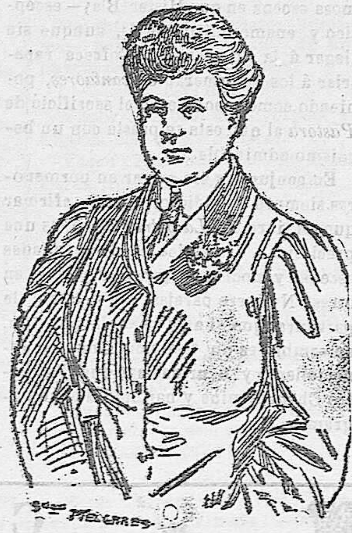
La reina Amelia

Todos los oficios y profesiones cuando no se ejercen bien tienen sus quebras, y como esto es una ley natural, dicho está que los reyes no quedan excluidos.