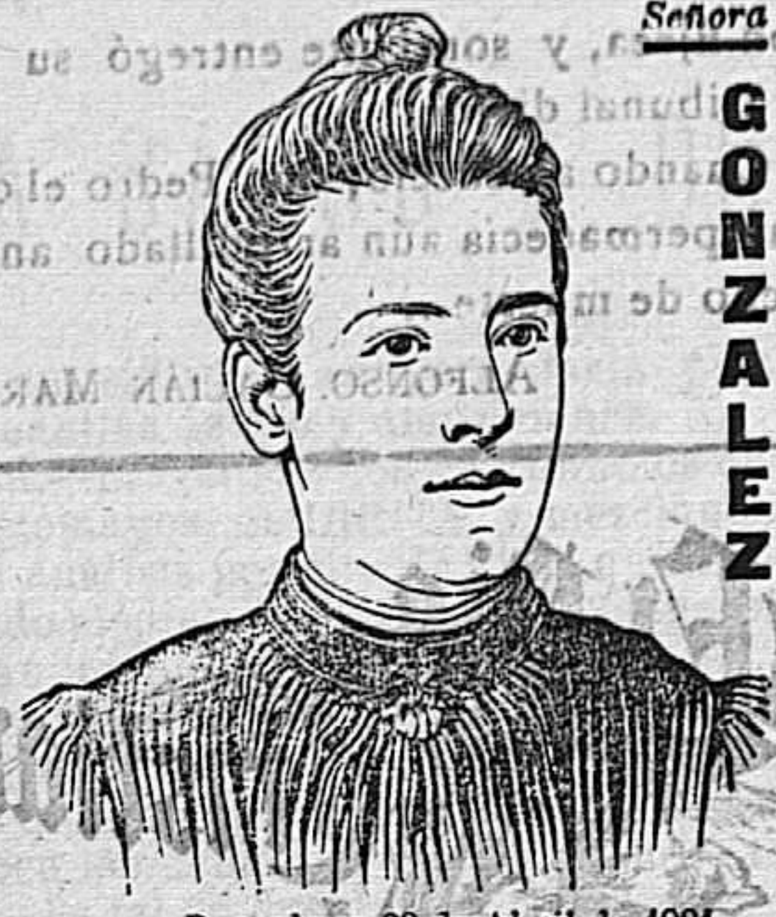
Barcelona 23 de Abril de 1901.