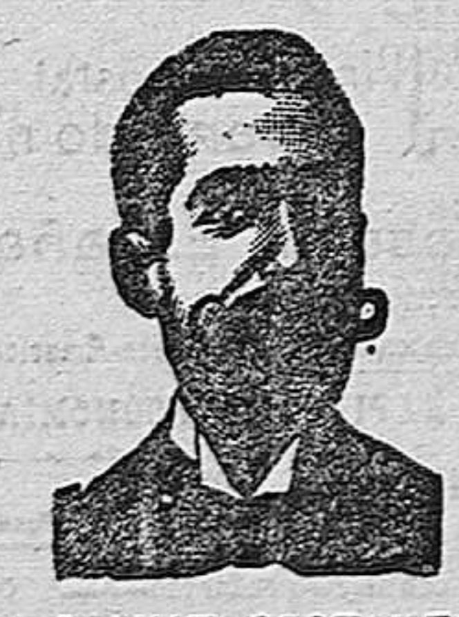
A. SALVATI COSTANZI CALLE DIPUTACIÓN, 435 BARCELONA

La fuerza motriz más económica. Motores «BENZ» á gas pobre, con generador que produce este gas del carbon de antracita. Consumo máximo por hora y caballo: 600 á 800 gramos de carbon de antracita ! equivalente á un gasto de 2 1 / 2 á 5 céntimos ! Se sirven motores con generador desde 4 hasta 75 caballos.—Instalación sencilla, sin peligros ni molestias de ninguna clase.—Referencias de primer orden. Richard Gans, Madrid Princesa, 63. Motores á gas «BENZ», id. á gasolina, id. á petróleo, id. eléctricos y dinamos.