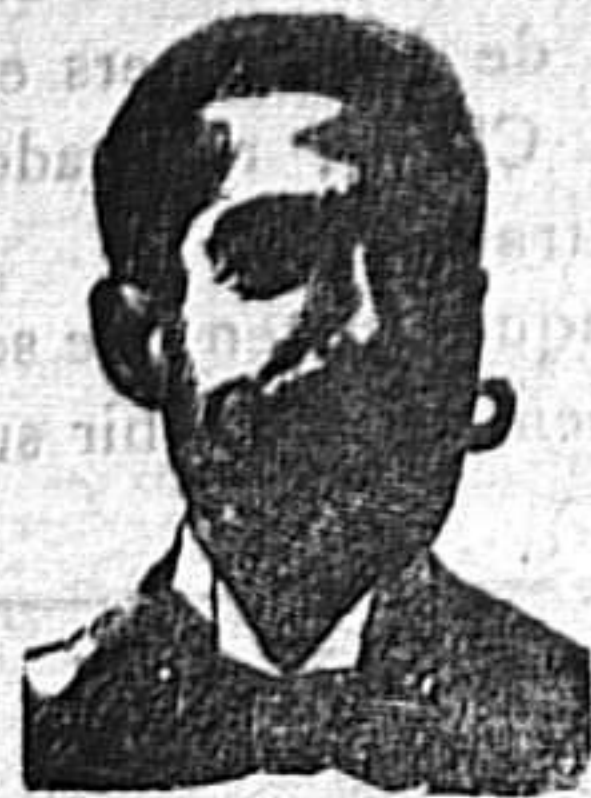
A. SALVATI COSTANZI Calle Diputación, 435.-Barcelona