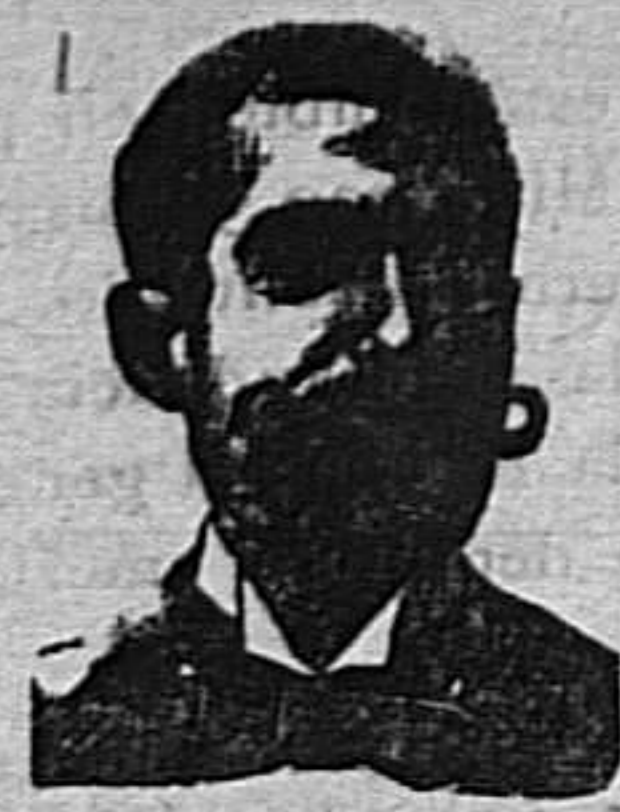
A. SALVATI COSTANZI Calle Diputación, 485.-Barcelona