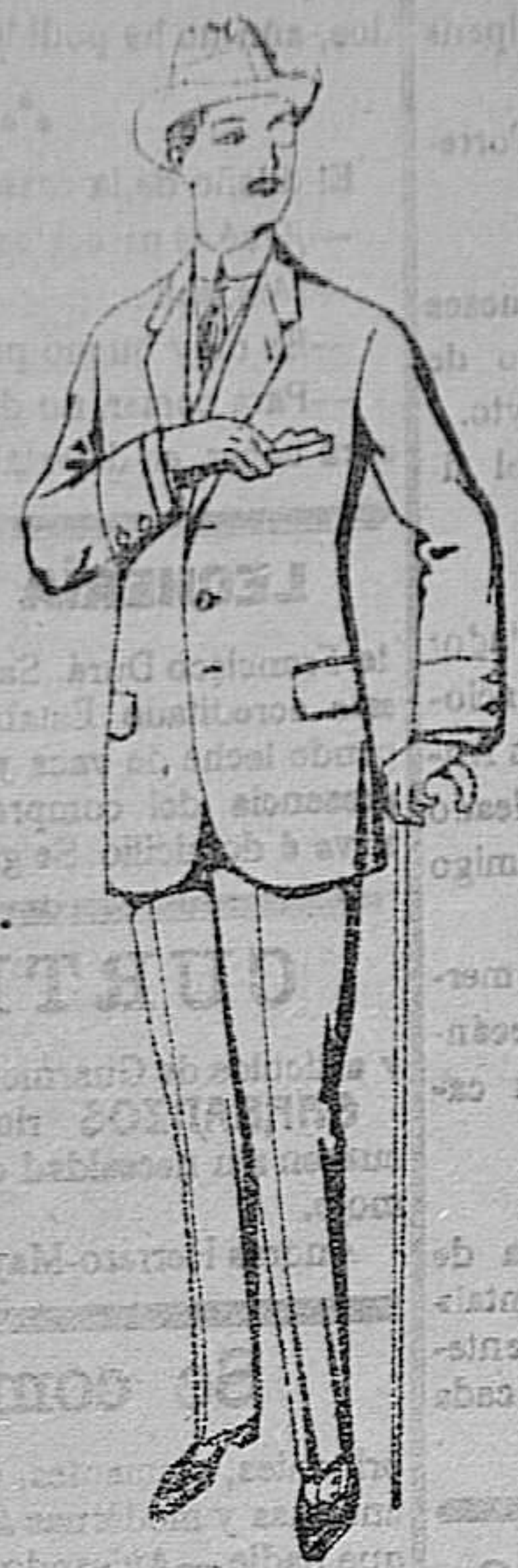
Trajes de lanilla cheviot de ptas. 17'50 á 70

Ropas confeccionadas para Caballero y niño y artículos de la Temporada