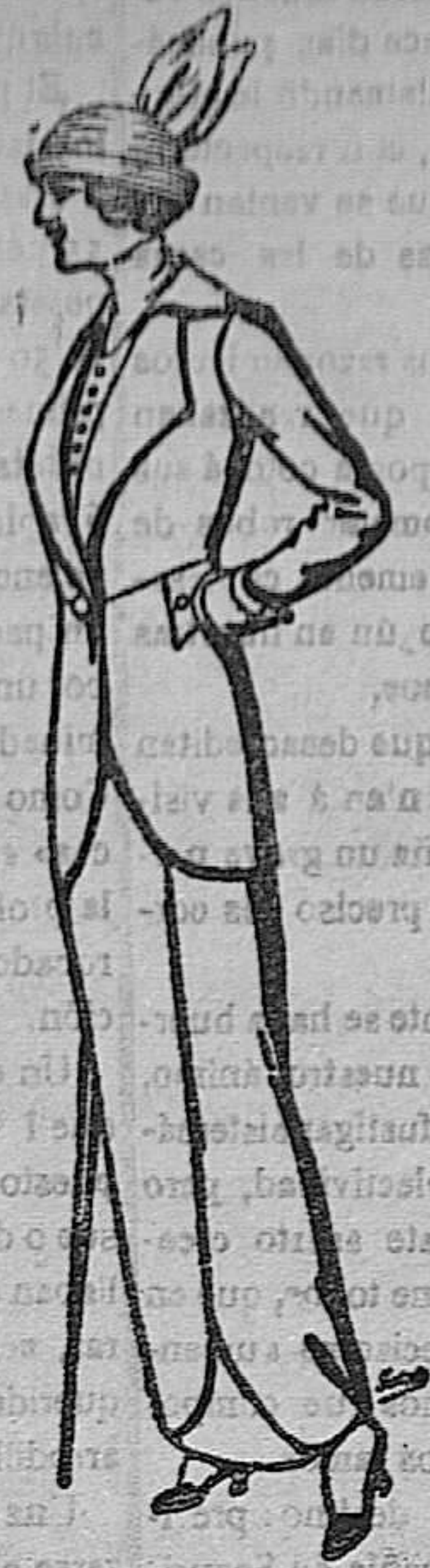
Traje de estambre para señora á ptas. 65 y 75