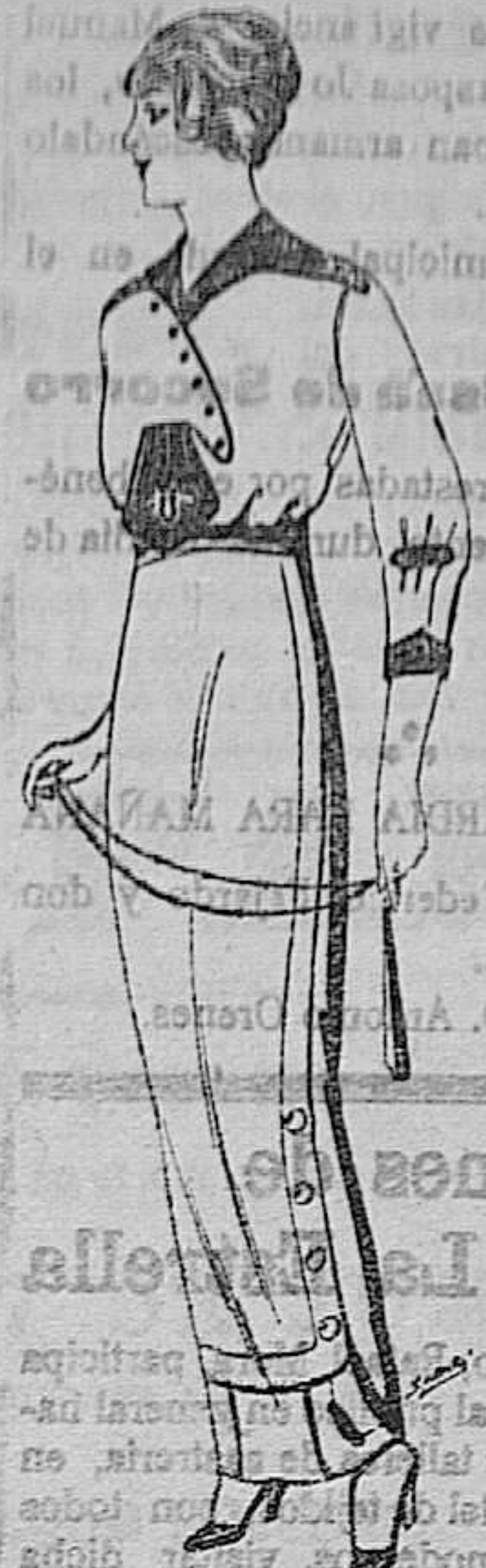
Blusa de seda blanca y colores, adornos bordados de ptas. 25. Faldas de lana de ptas. 11 á 22

Ropas confeccionadas para Caballero y niño y artículos de la Temporada