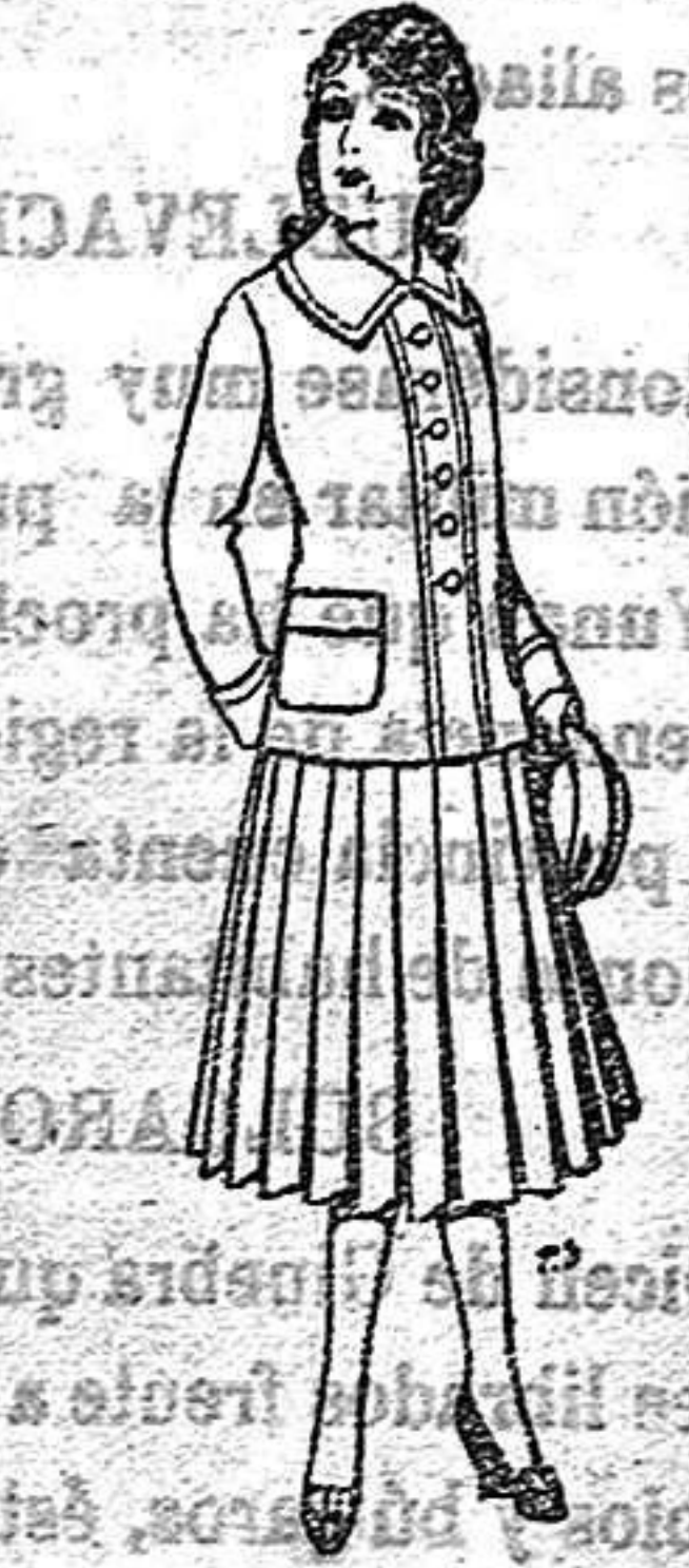
Paletor de lana para jovencitas de 13 a 16 años De 12.50 a 20 ptas.