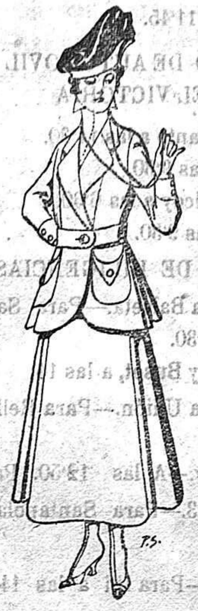
Trajes de lana negra azul y color para señora De 50 a 55 ptas.