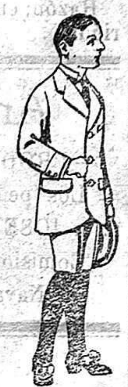
Trajes de paten para niños de 7 a 12 años De 16 a 40 ptas.