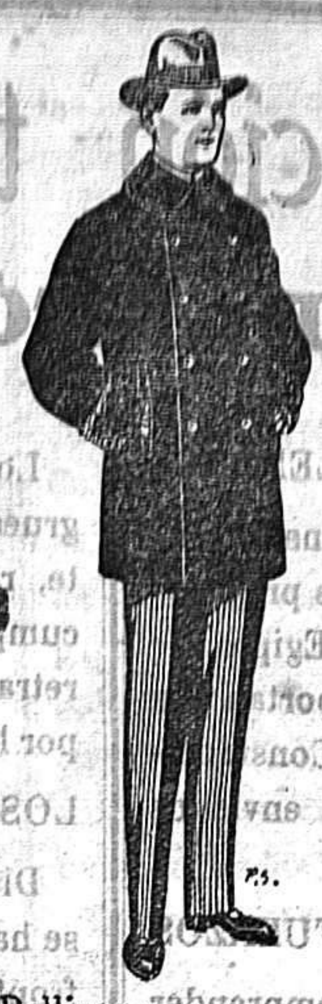
Pelizas con cuello y bocamangas astracán De 14 a 90 ptas.