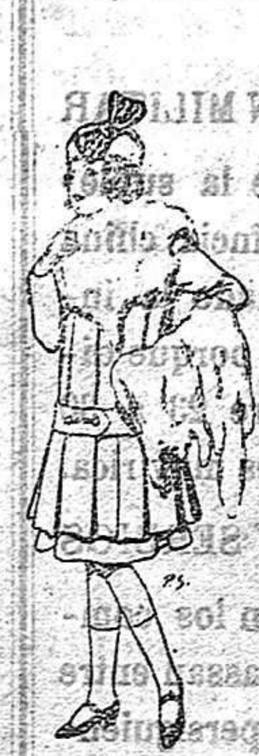
Juego de pieles para niñas A 15 ptas.