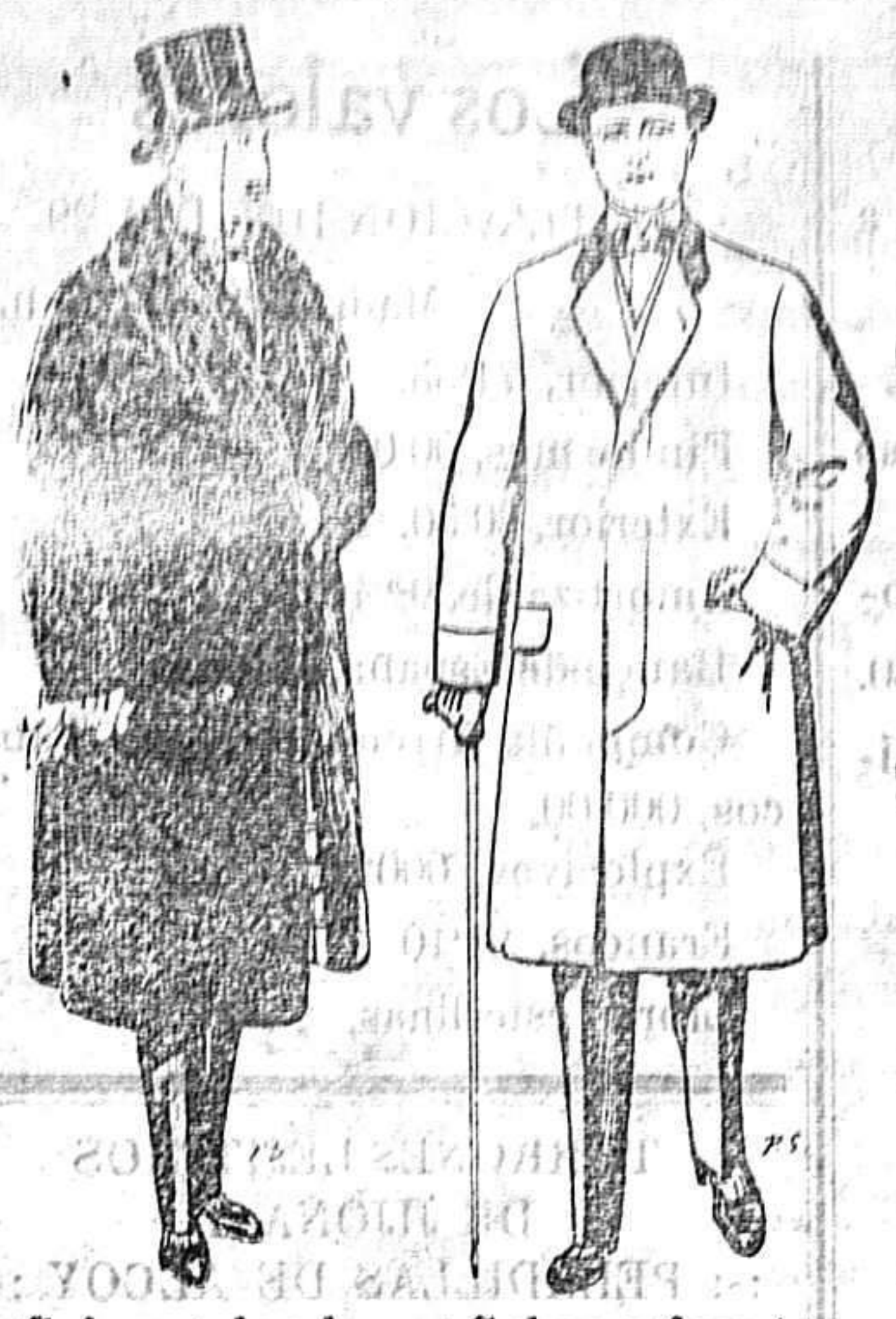
Gabanes de edredón negro forro seda cuello y vistas de piel A 125 y 135 ptas.

Peletería, Camisería, Géneros de Punto, Corbatería, Guantería, Sombrerería, Zapatería, Paraguas, Bastones y Artículos de Viaje.