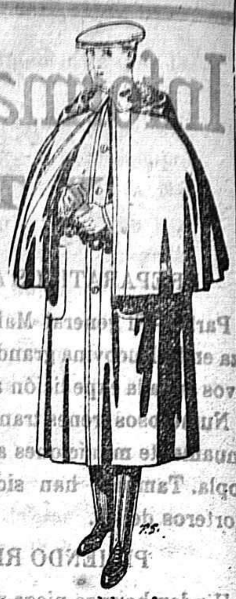
Impermeables, forma Mackerland en negro y azul De 55 a 110 ptas.