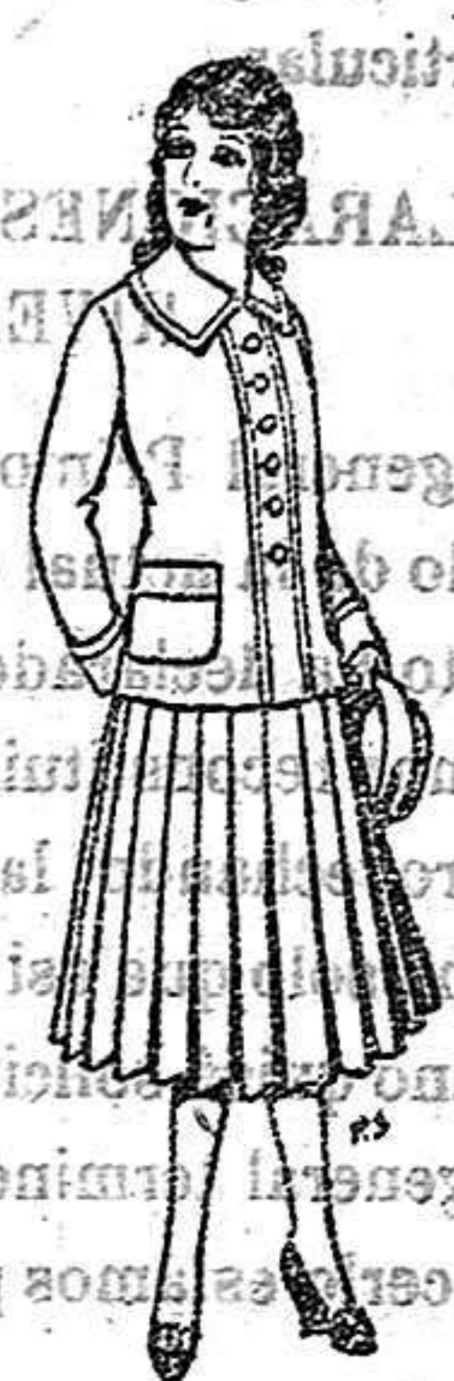
Paletor de lana para jovencitas de 13 a 16 años De 12'50 a 20 ptas.