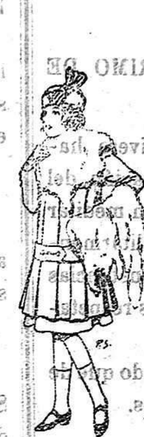
Juego de pieles para niñas A 15 ptas.