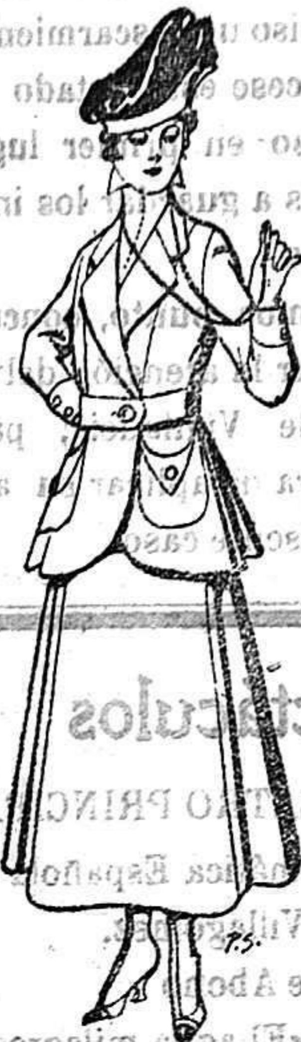
Trajera de lana negra, azul y color para señora De 50 a 55 ptas.