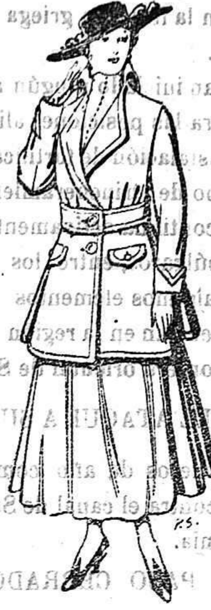
Abrigos de paten gran novedad para señora De 26 a 40 ptas.