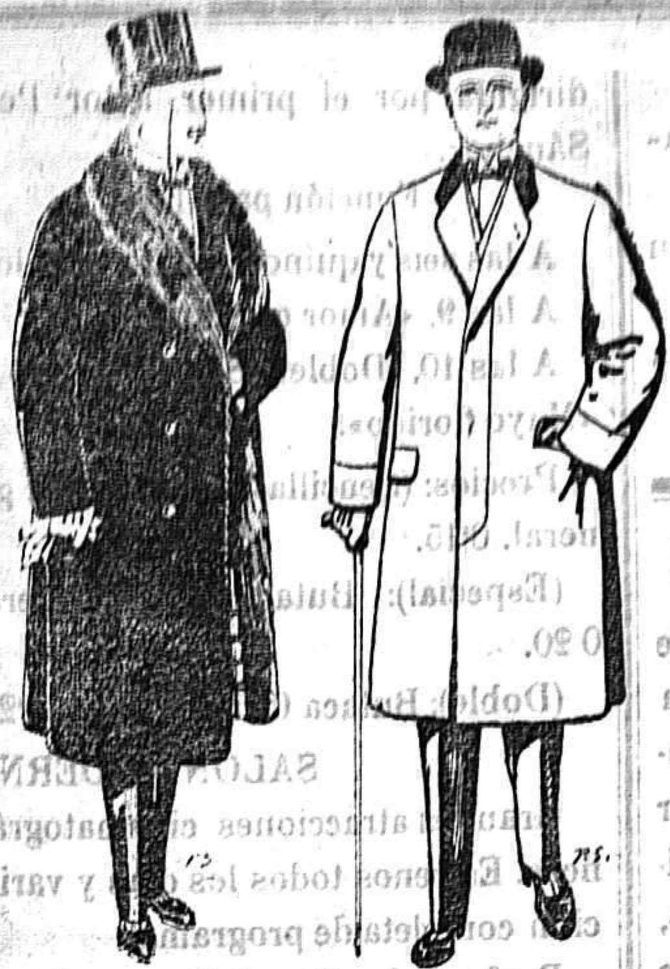
Gabanes de edredón negro forro seda cuello y vistas de piel A'125 y 135 ptas.

Peletería, Camisería, Géneros de Punto, Corbatería, Guantería, Sombrerería, Zapatería, Paraguas, Bastones y Artículos de Viaje.