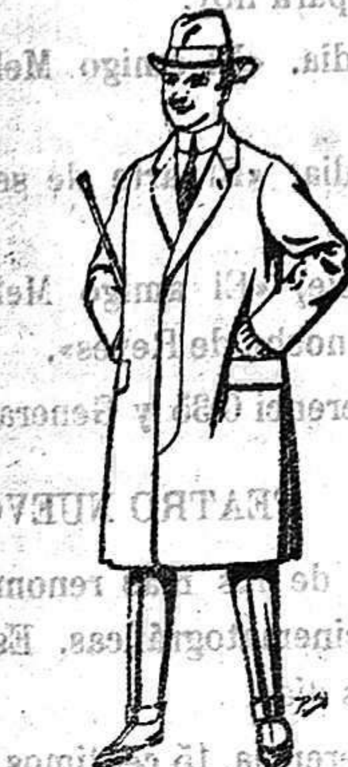
Gabanes de lana vigonia o melton para niños de 10 a 16 años De 20 a 56 ptas.