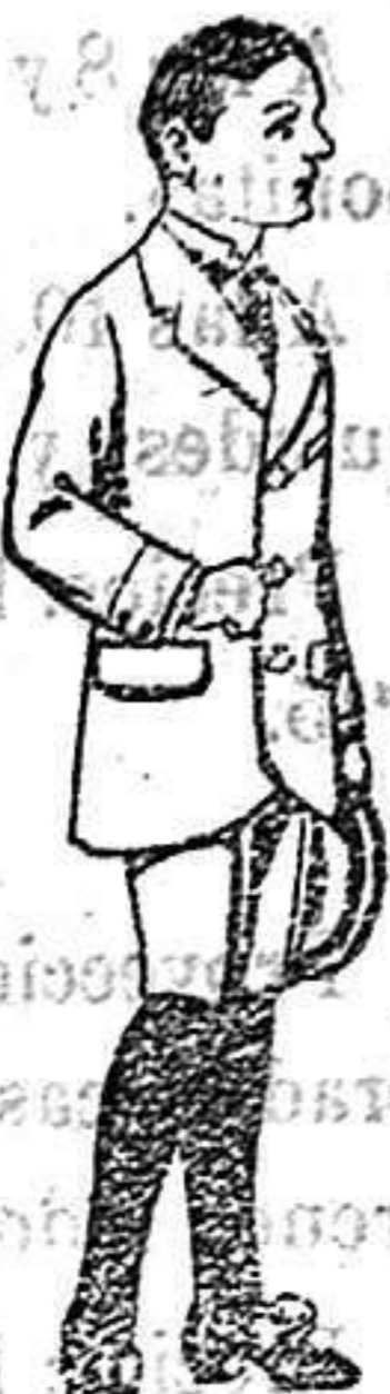
Trajera de paten para niños de 7 a 12 años De 16 a 40 ptas.