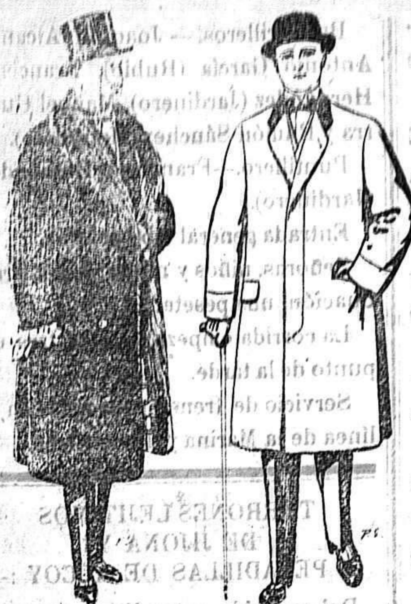
Gabanes de edredón negro forro seda cuello y vistas de piel. A 125 y 135 ptas.