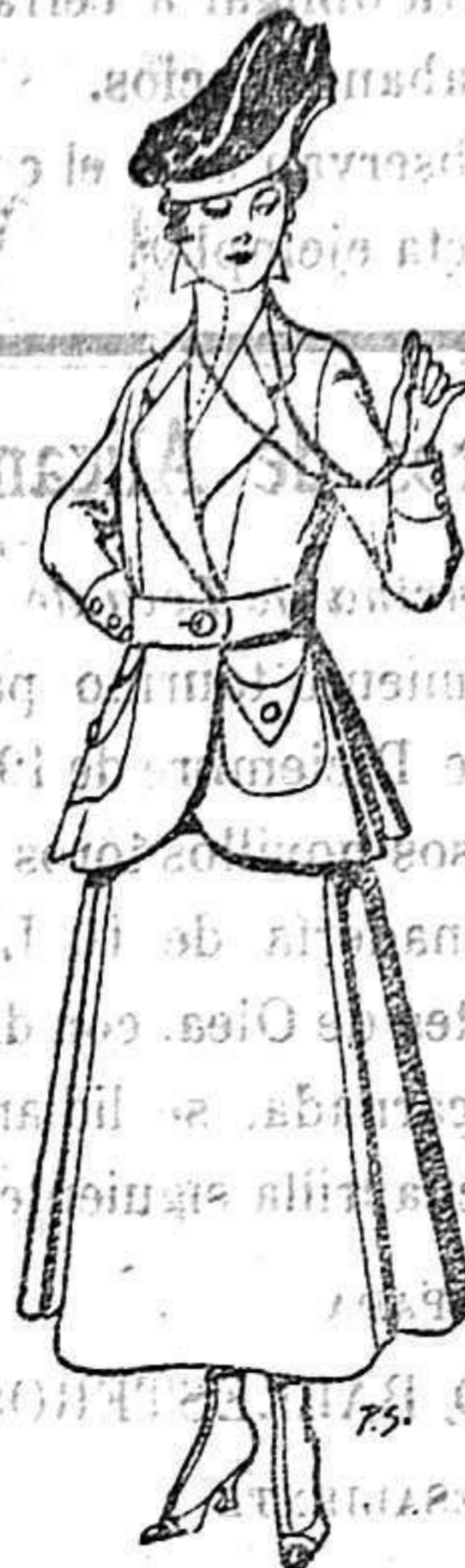
Trajes de lana negra, azul y color para señora. De 50 a 55 ptas.

Peletería, Camisería, Géneros de Punto, Corbatería, Guantería, Sombrerería, Zapatería, Paraguas, Bastones y Artículos de Viaje.