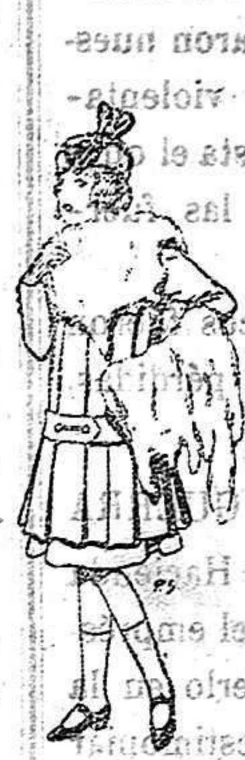
Juego de pieles para niñas. A 15 ptas.