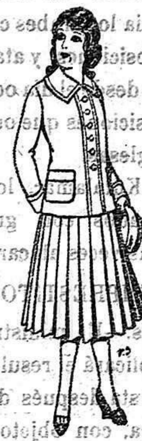
Paletor de lana para jovencitas de 13 a 16 años. De 12 50 a 20 ptas.