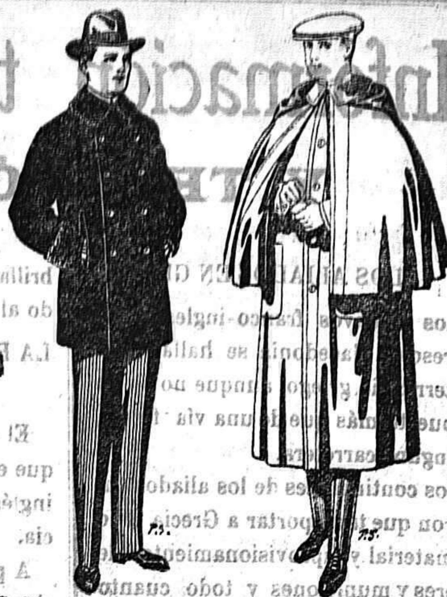
Pellicas con cuello y bocamangas astracán. De 14 a 90 ptas.