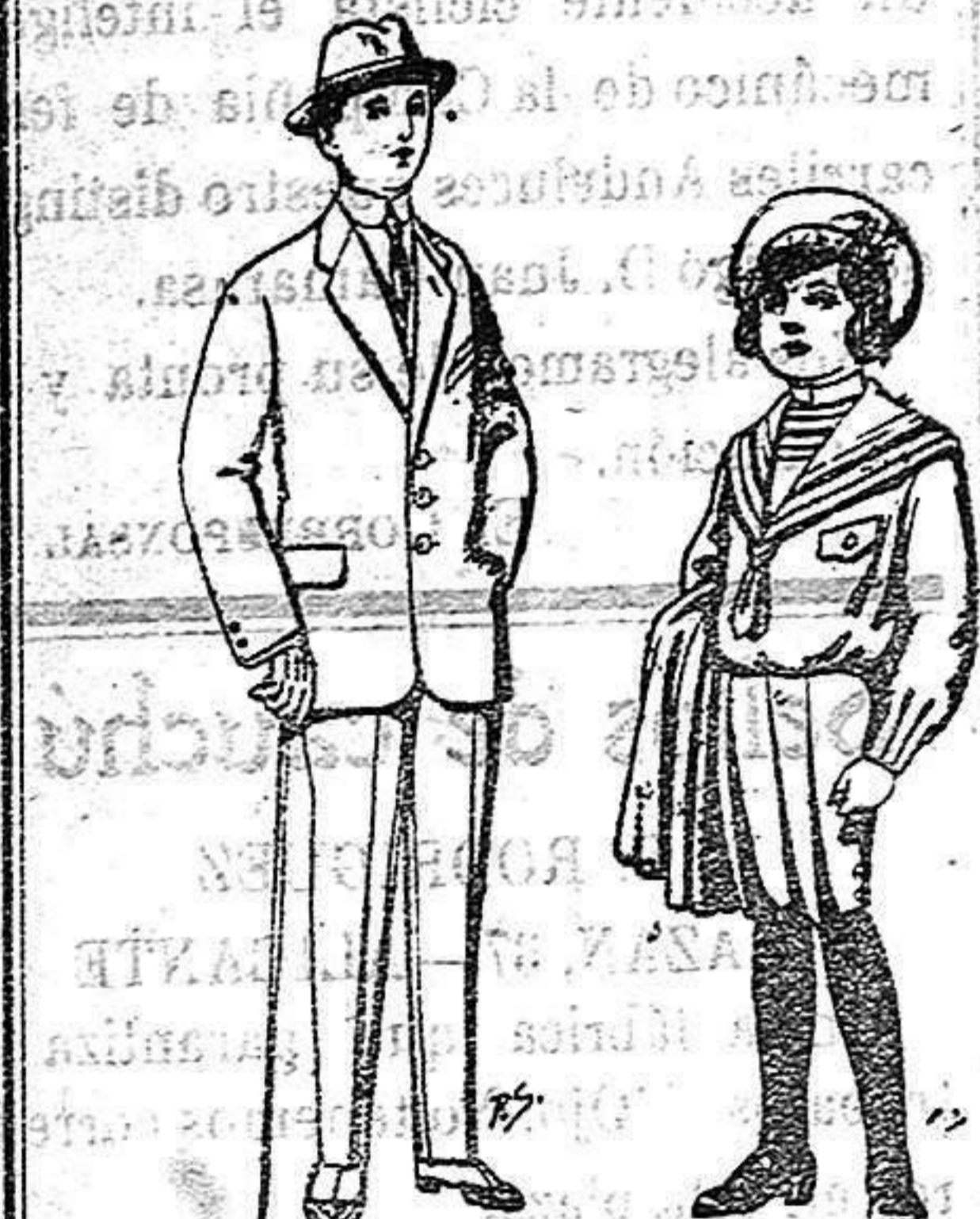
Trajes paten, vi-cuña o jerga para niños de 10 a 16 años. De 14 a 50 ptas. Trajes de jerga negra o azul para niños de 4 a 9 años. De 5 a 10 ptas