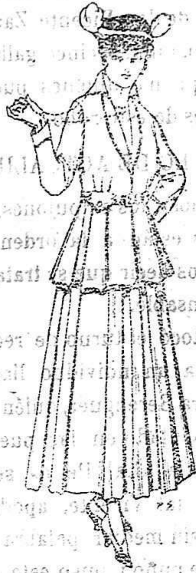
Trajes de lana negra, azul y color para señora. A 85 ptas.