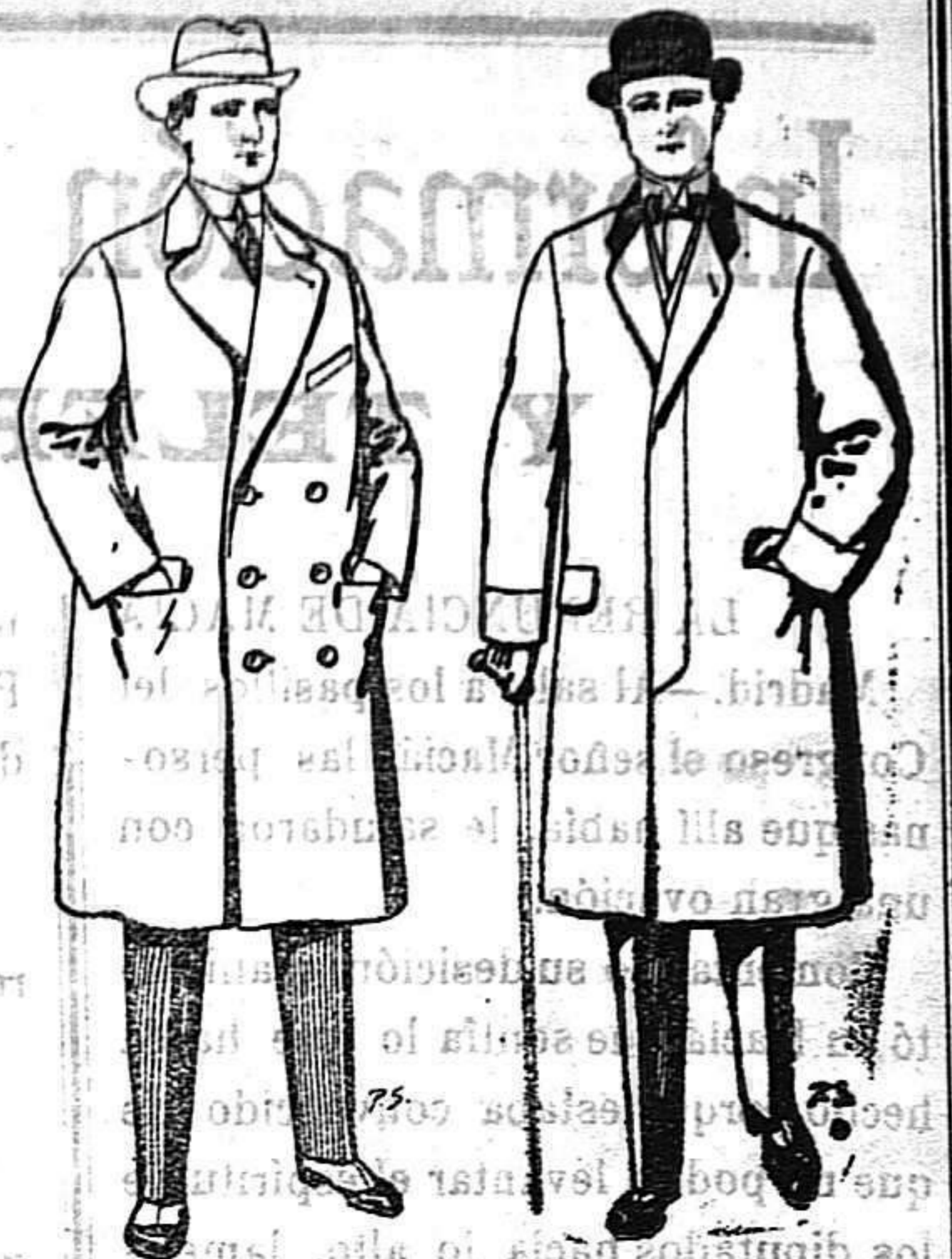
Gabanes de paten cheviot etc. De 55 a 105 ptas. Gabanes de paten melton o cheviot. De 25 a 100 ptas.