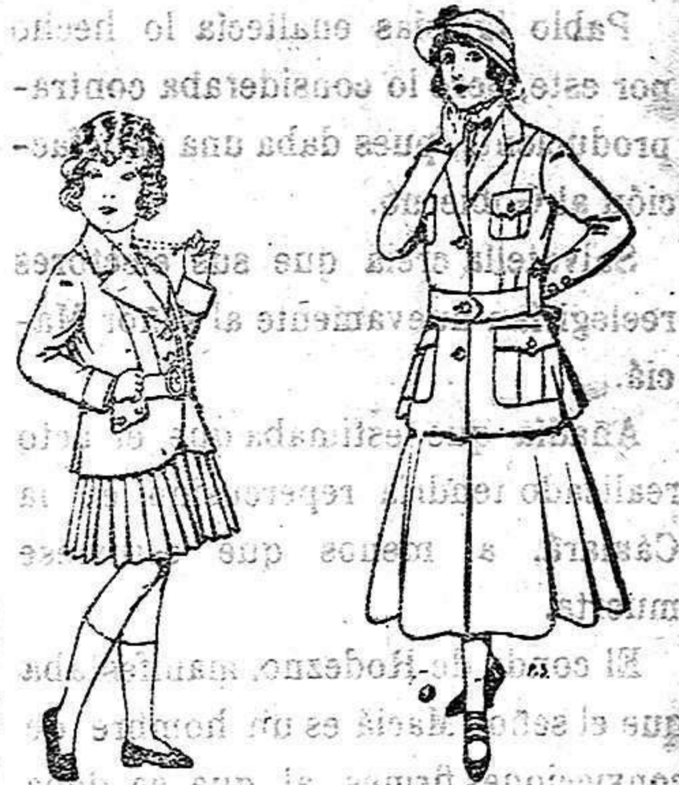
Trajes de lanilla para niñas de 4 a 11 años. De 20 a 35 ptas. Trajes de lana para jovencitas de 13 a 16 años. De 40 a 45 ptas.