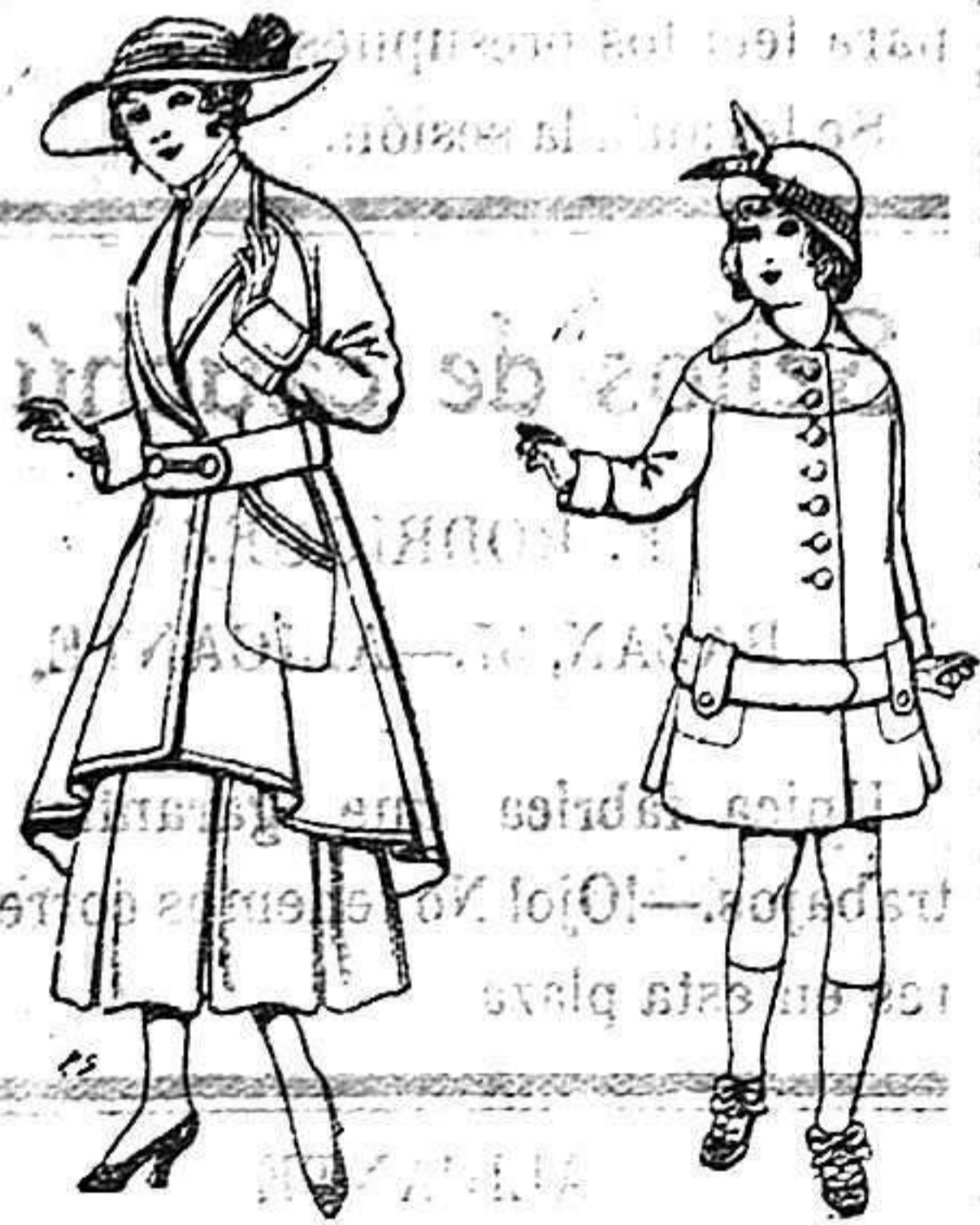
Abrigos de patén para jovencita de 13 a 16 años De 25 a 35 ptas. Abrigos de patén para niñas de 4 a 12 años De 15 a 25 ptas.