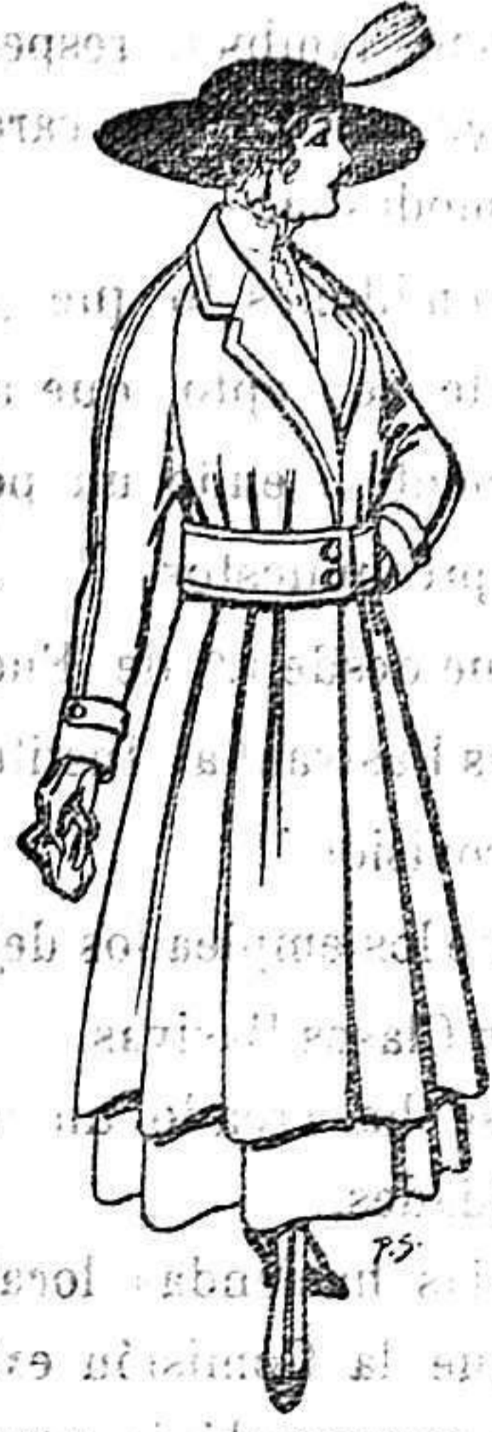
Abrigos de patén gran novedad para señora A 53 ptas.