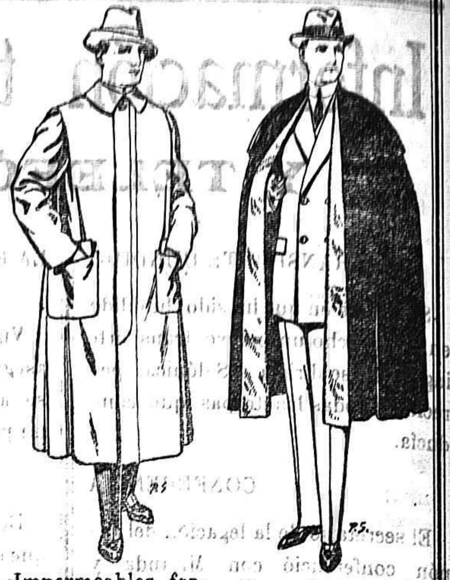
Impermeables forma gabán en color beige o gris De 35 a 100 ptas. Capas (enteras) de paño De 25 a 100 ptas.