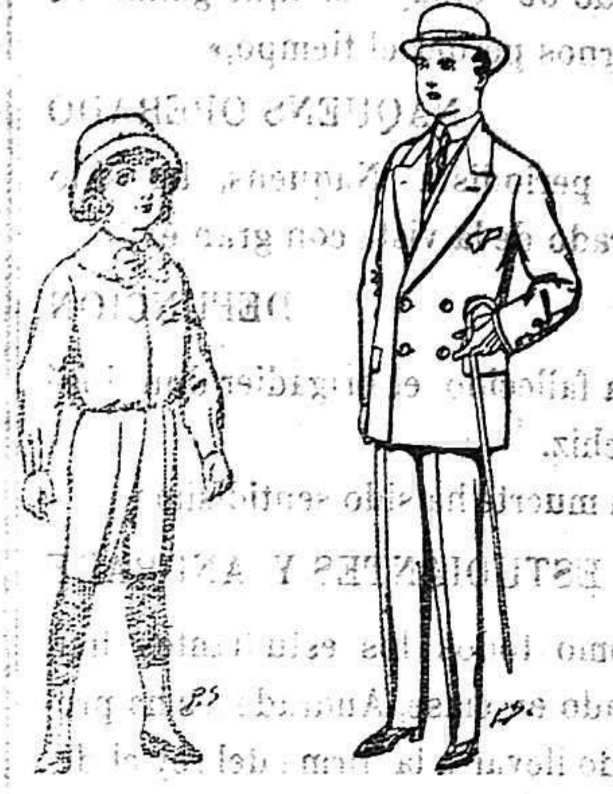
Trajes de patén para niños de 4 a 9 años De 5 a 7-50 ptas. Trajes de patén, vicuña etc., para niños de 10 a 16 años De 25 a 48 ptas.