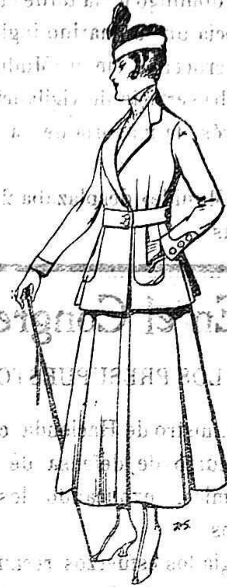
Trajes de lana negra, azul y color para señora A 65 ptas.