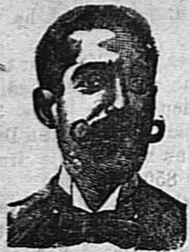
A. SALVATI COSTANZI Calle Diputación, 495.-Barcelona