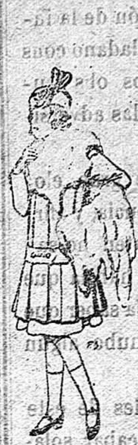
Juego de pieles para niñas A 15 ptas.