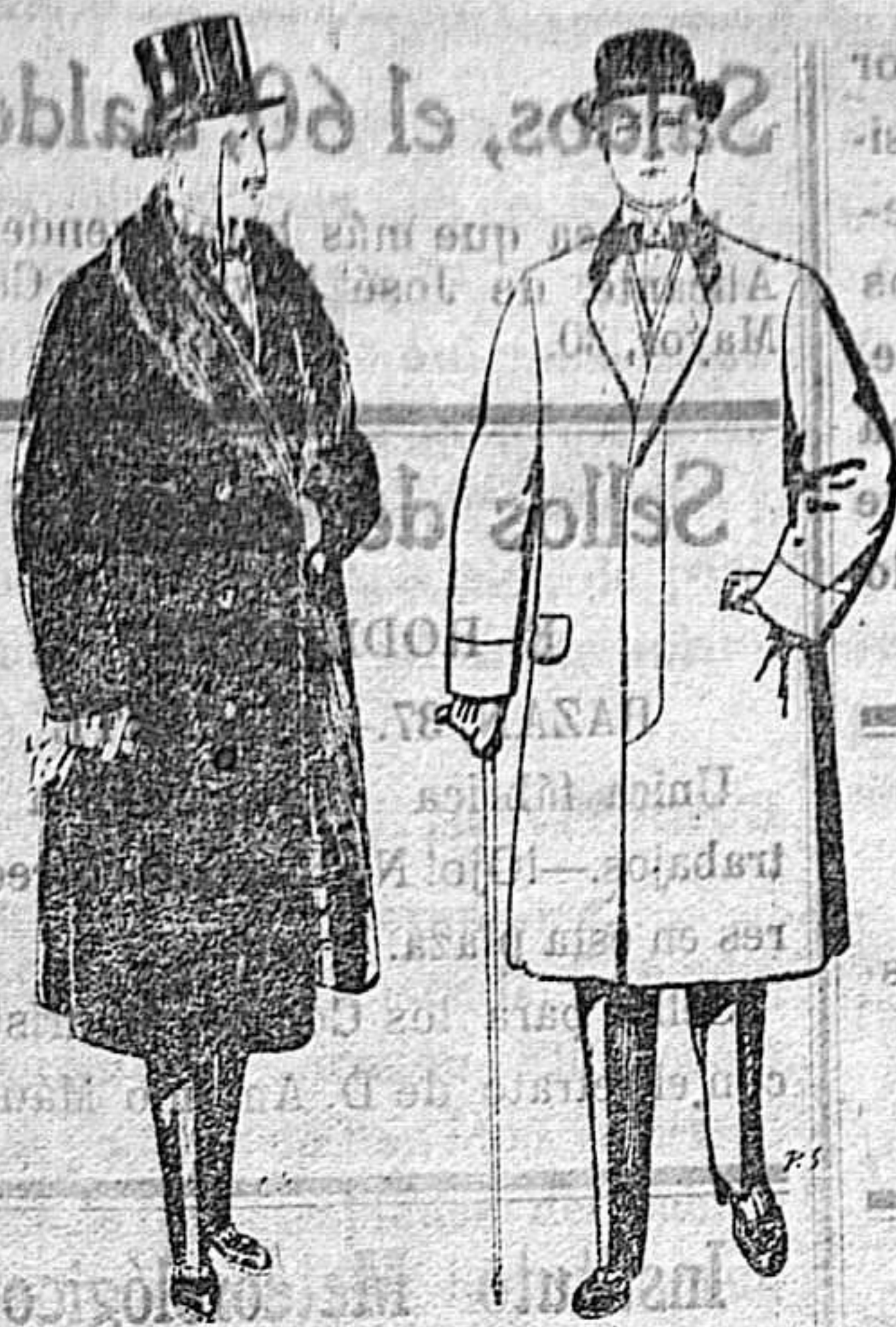
Gabanes de edredón negro forro seda cuello y vistas de piel A 125 y 135 ptas.

Peletería, Camisería, Géneros de Punto, Corbatería, Guantería, Sombrerería, Zapatería, Paraguas, Bastones y Artículos de Viaje.