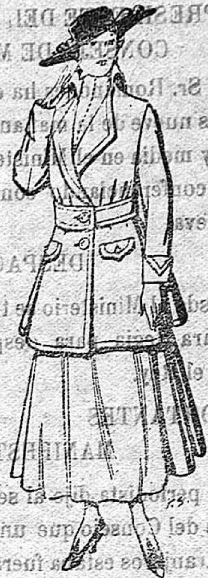
Abrigos de paten gran novedad para señora De 26 a 40 ptas.