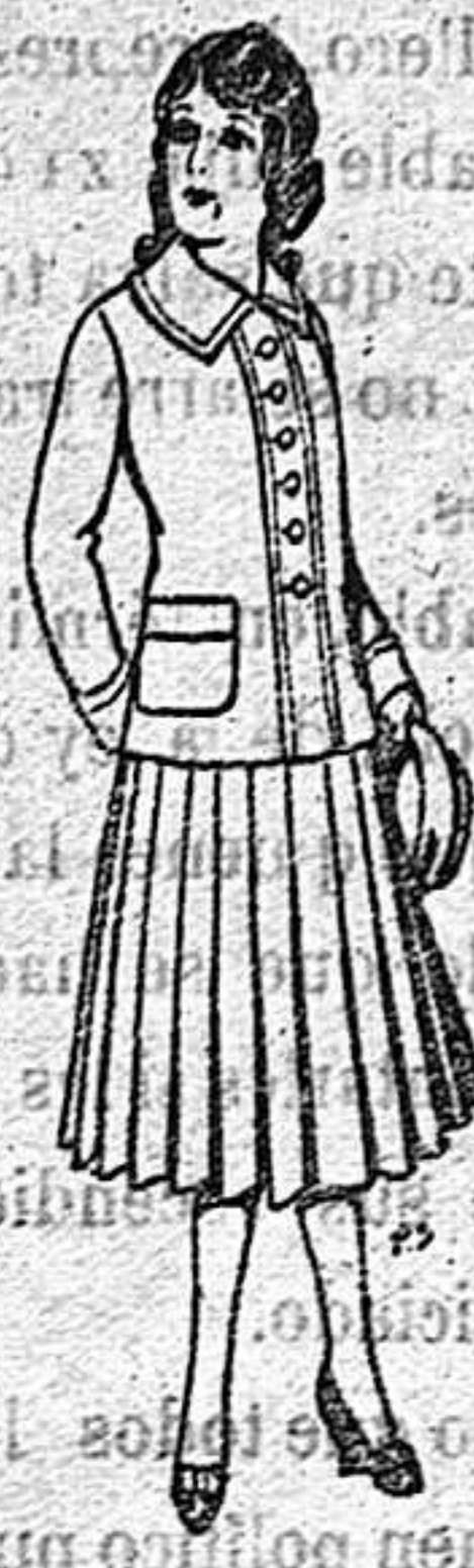
Paletor de lana para jovencitas de 13 a 16 años De 12-50 a 20 ptas.