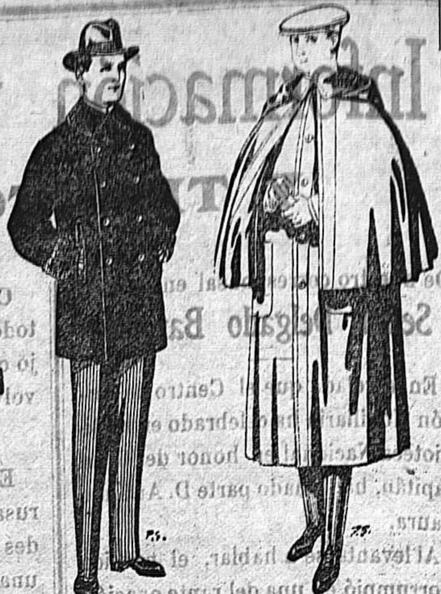
Pellizas con cuello y bocamangas astracán De 14 a 90 ptas. Impermeables, forma Mackferland en negro y azul De 55 a 110 ptas.