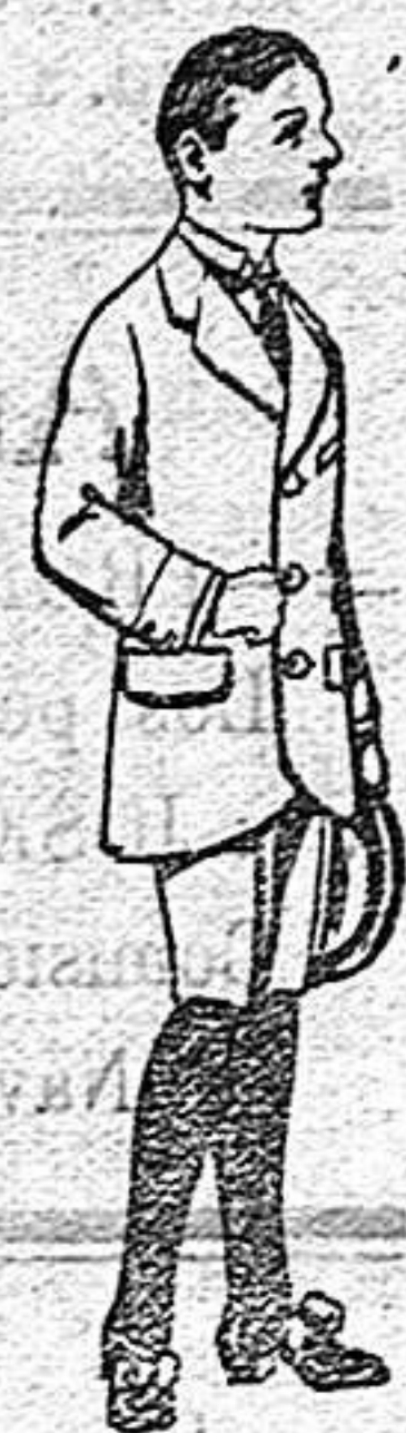
Trajes de paten para niños de 7 a 12 años De 16 a 40 ptas.