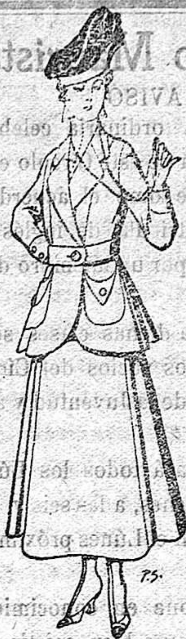
Trajes de lana negra, azul y color para señora De 50 a 55 ptas.