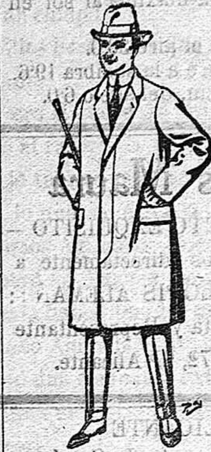
Gabanes de lana vigonia o melton para niños de 10 a 16 años De 20 a 56 ptas.