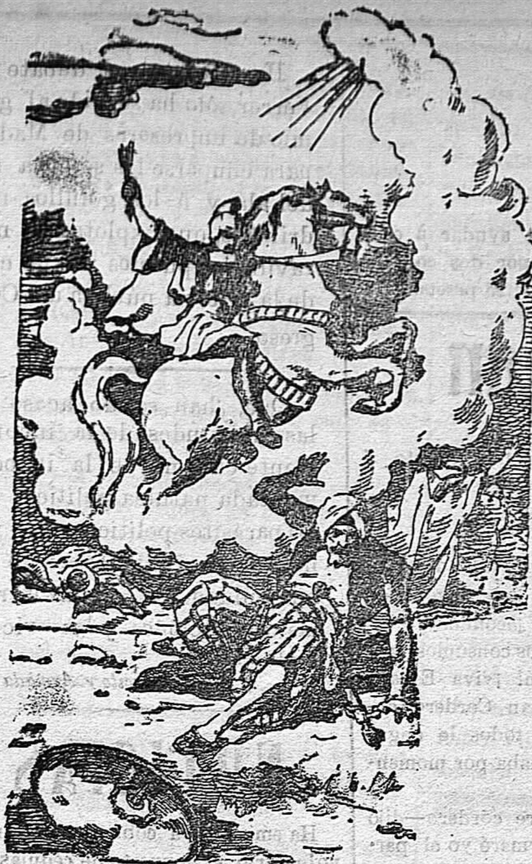
¡Juicio Mártir San Jorge! Veni in adiutorium populo Dei. Offic. eccles. Defiende al pueblo de Dios

Redacción y Administración Calle Pintor Casanova N.º 24