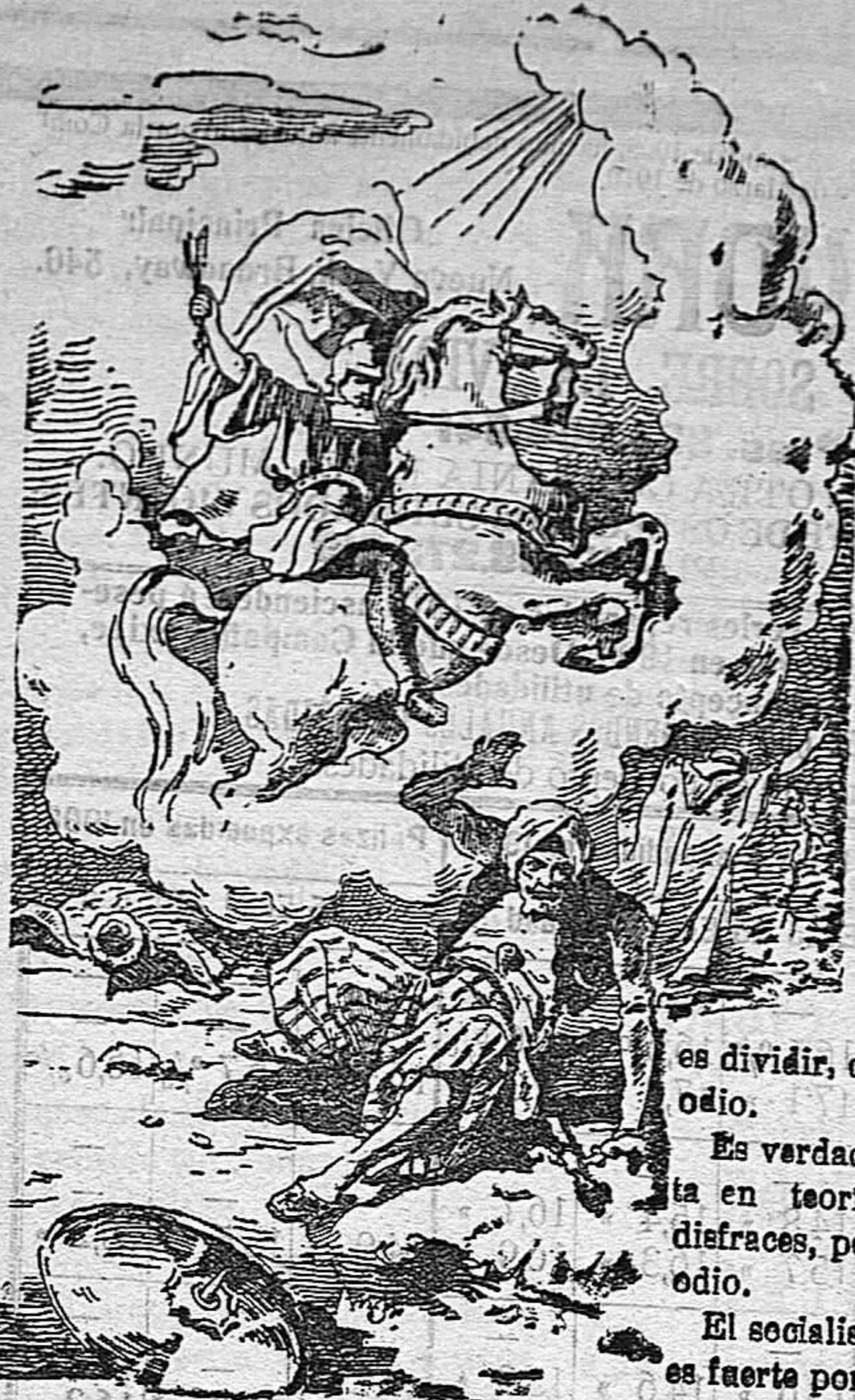
Juicio Mártir San Jorge Defiende al pueblo de Dios

Precios de suscripción Alcoy al mes . . . . . 1'50 Ptas. Para los obreros al mes . . . . . 6'75 Ptas. Fuera al trimestre . . . . . 4'50 Ptas. Número atrasado . . . . . 0'16 Ptas.